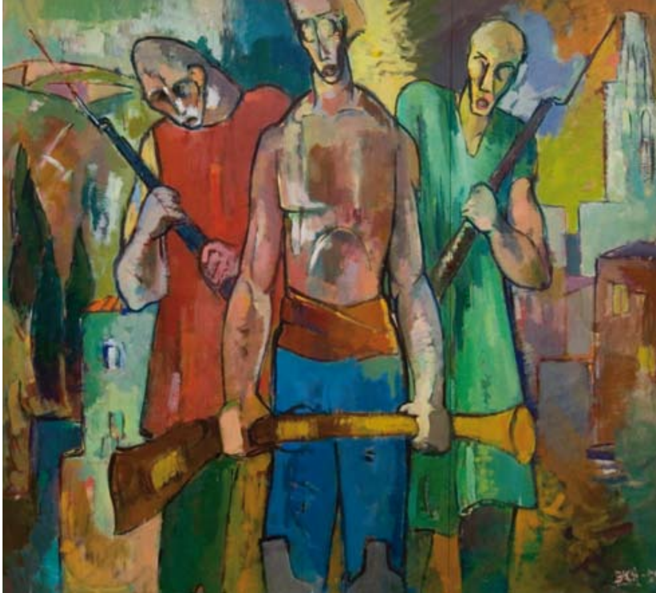
>> A dalt, Girona, 1809, oli de Pere Bech (1959).