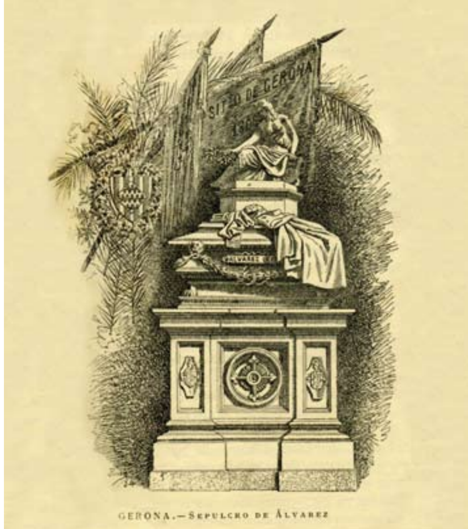
>> Dibuix a la ploma de Pascó (1884).

el 1868, el llibre de Lluís Cutchet... Ubicades dins la tradició liberal, aquestes obres presenten els habitants de Girona més com a ciutadans-soldats al servei de la nació que no pas com a defensors de la religió. Aquesta lectura nacionalista és tanmateix regionalista, en el sentit que, segons aquests autors, fou en la seva història particular que la província va trobar l'energia necessària per rebel·lar-se. Es constata així com la sensibilitat de la Renaixença alimentà un patriotisme espanyol profundament arrelat en la realitat local però que reforçava in fine la cohesió nacional.