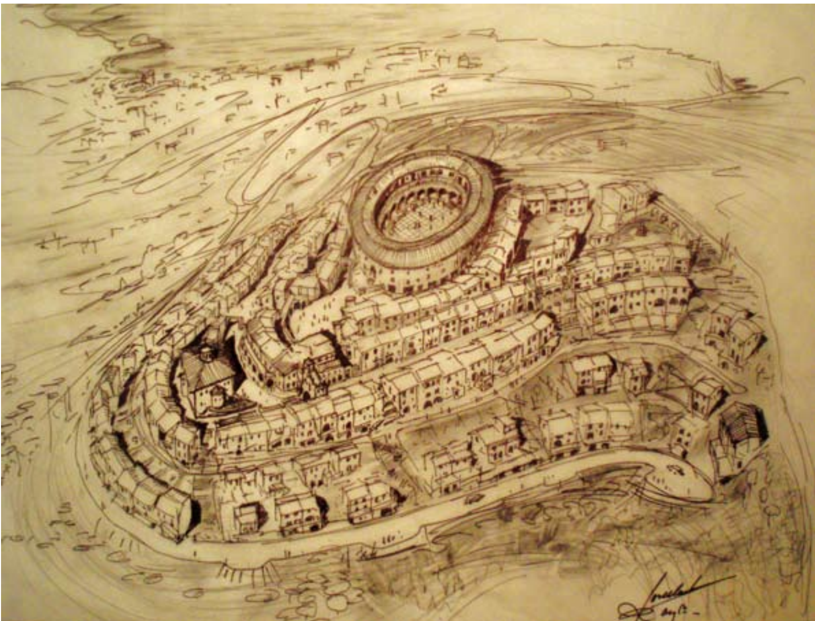
>> Perspectiva del projecte d'urbanització de la muntanya de Montgó, de l'Escala.