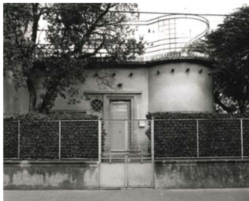
JOSEP M. OLIVERAS. ARXIU HISTÒRIC COAC. DEMARCACIÓ DE GIRONA.