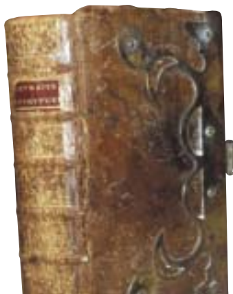
>> Detall del llibre vist de perfil.

Tot i que m'he documentat tan bé com he sabut, no vull fer passar el bou per bèstia grossa; vull dir amb això que no em considero un especialista en aquesta matèria. Us demano, doncs, que no em poseu una pistola al pit. Penso, però, que aquesta troballa pot interessar a curiosos, col·leccionistes o estudiosos de les