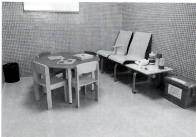
Sala d'espera d'un CAP.

escriure, que més de la meitat ha cursat estudis primaris, que el 29% té un nivell d'estudis secundaris i que només un 17% cursa estudis superiors. La presència immigratòria a les comarques gironines constitueix un 18,78% del total de la població, xifra important afavorida, sens dubte, per la llei d'agrupament familiar, que fa possible la implantació de nombroses famílies estrangeres al nostre territori.