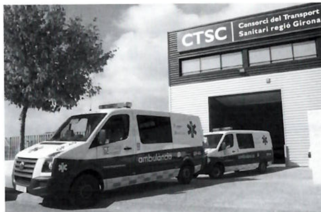
Ambulàncies del Consorci Sanitari.

Les instal·lacions disponibles al servei de la salut dels gironins a les nostres comarques comprenen una xarxa de 36 centres d'atenció primària, 9 hospitals, 14 centres sociosanitaris i 15 centres de salut mental