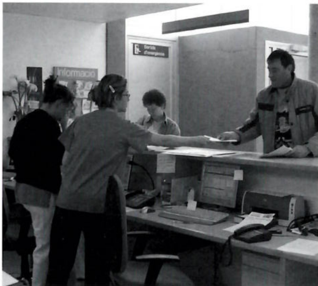
Tauler de recepció del CAP de l'Escala.

més prescrits són analgèsics, diürètics, hipoglucemians orals, broncodilatadors i psicofàrmacs.