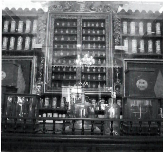
Antiga farmàcia de l'Hospital de Santa Caterina.

professionals més necessàries i reclamades pels auxiliars sanitaris: el seu primer Codi de Moral.