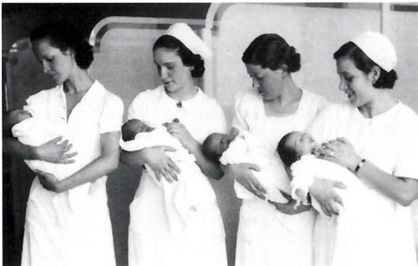
Infermeres de la maternitat durant la postguerra.