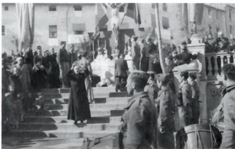
Primera missa de campanya al Firal, en celebració de la victòria, el 8 de febrer de 1939. La imatge apareix en una pel·lícula seva.

Un antecedent propici va ser l'Amateur Club fotogràfic i cinematogràfic, que havia nascut en 1958 i que es liquidà a la primavera de 1979. Aquesta entitat, la primera en la història cinematogràfica d'Olot a dedicar-se al cinema amateur i independent amb caire divulgatiu i competitiu, va tenir una notable activitat en la fotografia i en el cinema. En el camp cinematogràfic, entre diverses iniciatives, es va instituir el Festival Nacional de Cinema Amateur, d'àmbit estatal, que proporcionà l'oportunitat als olotins de poder