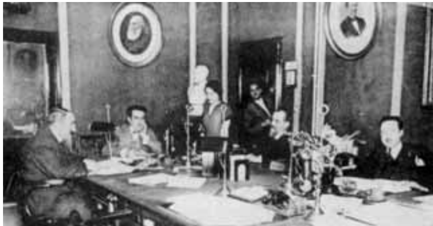
La redacció del diari L'Indépendant de Perpinyà, els anys 30 del darrer segle.

L'especial configuració d'aquell territori, la seva geografia política, perfectament definida com a meitat de França meitat d'Espanya, amb una frontera que mutila territori i famílies, una capitalitat comarcal evident