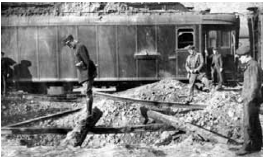
Efectes del bombardeig franquista a les instal·lacions ferroviàries de Cervera de la Marenda, el 26 de maig de 1938.

cional, molts francesos, que van lluitar en el bàndol republicà van creuar la frontera per Puigcerdà sense problemes. L'ambient polític, a la banda francesa de la comarca, es va mantenir favorable al Govern de la República en el decurs de tota la guerra, però els efectes de l'actuació anarquista van resultar del tot negatius en l'opinió pública nord-catalana, com escriu Louis Blanchon: «Quan els testimonis de la Cerdanya francesa fan memòria del fet de 1936-1937, poques vegades esmenten activitats polítiques. Però evoquen l'evident inquietud que els inspiraven "els de la FAI" de Puigcerdà o les angoixes familiars quan els parents d'Espanya, fugint de la República s'instal·laven a casa seva. L'experiència anarquista de Puigcerdà és evocada com un malson a la vall alta del Segre».(8)