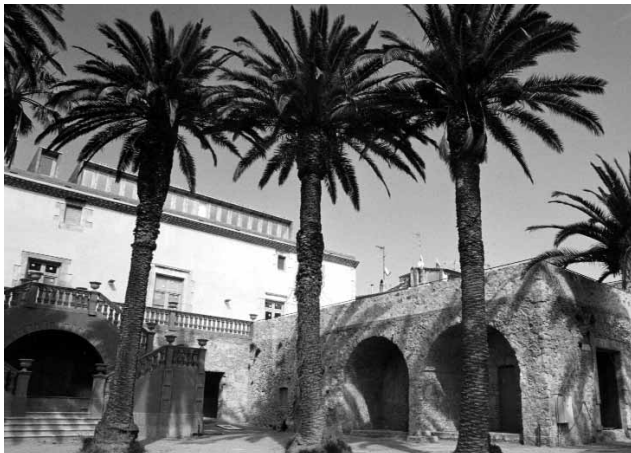
La casa pairal dels Quintana.

vera llibertat. La llibertat de pensar, el respecte a totes les idees i a totes les crencies, la tolerància perfecta, són la conseqüència natural i lògica de la llibertat dels homes, aixís com el fanatisme i la intransigència són fills legítims de l'absolutisme [...]. I els que no volen la llibertat igualment per a tots, els que no practiquen la perfecta tolerància, els qui volen imposar per la força llurs idees i no respecten la llibertat dels altres són sempre absolutistes, dèspotes, fanàtics [...].(30) Si La Crònica va ser el mitjà del catalanisme progressista de Vergés i Barris, Baix-Empordà , fundat per Miquel i Avellí l'any 1909, representava, en canvi, el catalanisme conservador de La Lliga. A diferència del setmanari de Vergés, de vida molt efímera, Baix Empordà , vertader portaveu de la patronal surera, va perdurar fins a l'esclat de la Guerra Civil.