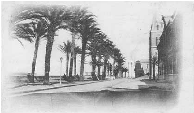
El carrer Barris a La Calle, detall que ens ajuda a valorar el pes de l'empresa gironina.

No era pas, és clar, una formulació independentista, sinó més aviat autonomista; una proposta que bevia dels corrents anticentralistes del federalisme i que advocava per la defensa de la cultura i la llengua catalanes, però que no qüestionava la integració de Catalunya en el conjunt del projecte espanyol. L'Estat espanyol, però, havia posat al descobert la seva incapacitat de defensar els seus interessos, o si més no, els dels fabricants; ja des de la constitució de les primeres Corts de la Restauració els diversos governs no havien estat a l'altura de les seves demandes.