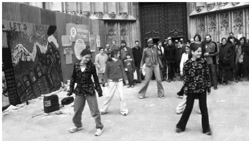
Pintada d'un mural a la plaça dels Apòstols de Girona.

El segon bloc és encara més decebedor. Ens recreen a tort i a dret i d'una manera incomprendible, també el bisbe amb insistència, que trenquem i som causa de divisió en l'Església i especialment en el presbiteri. Sempre que es demana unitat des del poder es pretén imposar la submissió i la uniformitat com a elements bàsics i indiscutibles. Tampoc en l'Església no hi ha manera de trencar aquesta dinàmica. I, malgrat tot, ens hem entestat a intentar que la diversitat enriqueixi la unitat i que la visió polièdrica de la veritat acabi oferint-ne una perspectiva més estimulante i engrescadora. No podem acceptar que cap persona ni cap grup monopòlitzi la possessió de la veritat i exclouï qualsevol dissidència. La unitat només esdevé viva i real quan aconseguim convertir les divergències en complementarietats i construir una Única Veritat amb les peces que tots hi aportem des de la humilitat i la solidaritat.