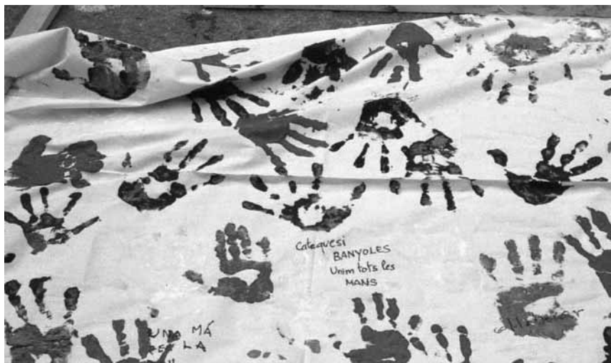
«No a la derrota de la humanitat», amb l'adhesió d'una vintena d'entitats i grups