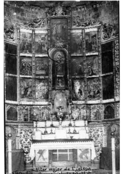
Retaule renaixentista de Santa Cecília. Era a l'altar major de l'església parroquial de Molló.

La recerca de fotografies i gràfics exigeix una tasca laboriosa i continuada. Sortosament, són cada dia més els municipis que es van dotant d'un arxiu amb un fons fotogràfic aportat per veïns de la localitat. També cal acudir als arxius específics d'imatges de les seus comarcals, a la Diputació (arxiu d'imatges EMB) i al Col·legi d'Arquitectes, sense oblidar-ne d'altres, com l'Arxiu Mas de l'Institut Amatller de Barcelona, l'Arxiu Mossèn Trens de la diòcesi barcelonina i l'important fons guardat en el Museu d'Arqueologia de Catalunya a Girona. D'arxius parroquials que conservin documents de retaules i alguna fotografia original del primer terç de segle XX n'hi ha pocs, i molts docu-