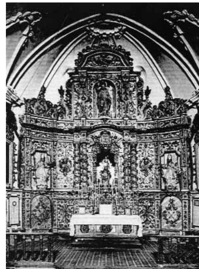
Retaule barroc de Sant Sebastià. Era a l'ermita de Sant Sebastià de Palafrugell.