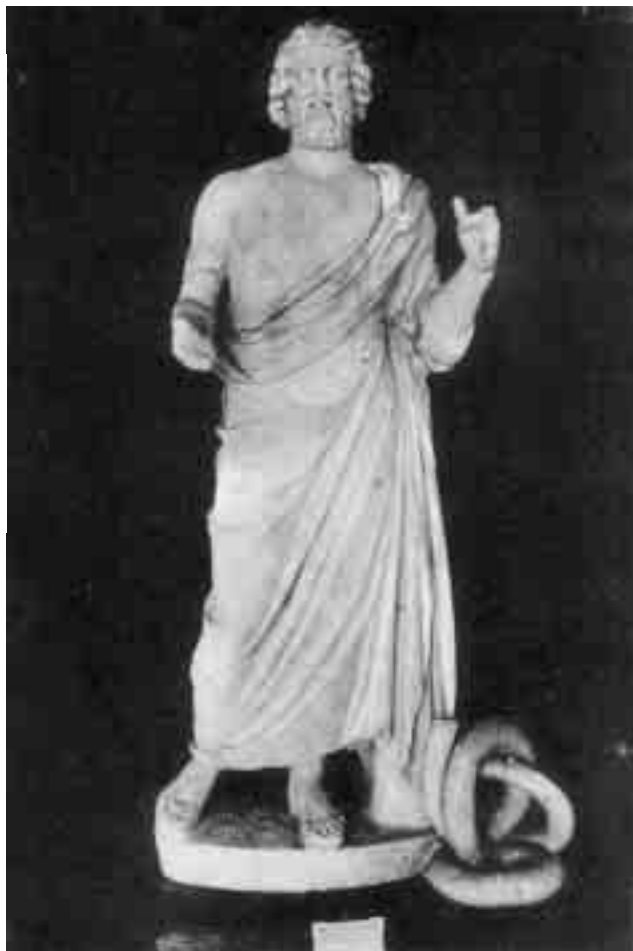
Escultura d'Asclepi, trobada l'any 1909 a Empúries, en una postal del fotògraf escalenc Josep Esquirol.

materials arqueològics d'Empúries, avui dia ubicats en quatre espais diferents i sense cap connexió entre ells, sinó que alliberarà aquests espais actuals de magatzem i permetrà multiplicar l'exposició permanent del museu, crear una sala d'exposicions temporals i donar ubicació als tallers didàctics. El projecte de construcció del nou centre de visitants a l'entrada del conjunt arqueològic, redactat pel despatx d'arquitectura de Fuses i Viader, facilitarà la comprensió del jaciment i també que els 223.000 visitants anuals que rep Empúries disposin d'uns serveis de major qualitat, adequats a les necessitats de la societat del segle XXI. El projecte d'ordenació dels