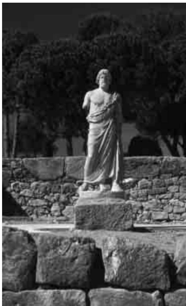
FONS FOTOGRÀFIC MAC-Empúries

Imatge virtual del futur centre de visitants d'Empúries, dissenyat per l'equip d'arquitectura Fuses i Viader i que estarà situat a l'entrada del conjunt monumental.