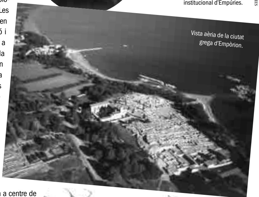
Vista aèria de la ciutat grega d'Empòrion.