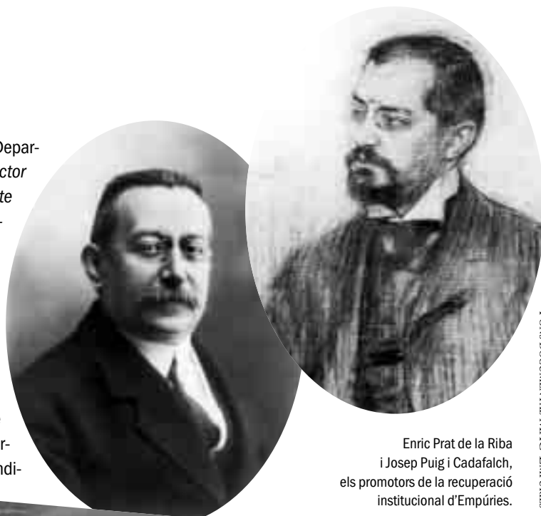
Enric Prat de la Riba i Josep Puig i Cadafalch, els promotors de la recuperació institucional d'Empúries.

El Pla director volia incidir, sobretot, en l'evolució històrica d'Empúries i en la seva imbricació amb el territori, més enllà dels límits administratius actuals del Museu d'Arqueologia de Catalunya-Empúries i més enllà del seu passat grec i romà. Per això, es proposava incorporar en el seu marc d'actuació els períodes històrics anteriors a la fundació de l'empori grec, que només s'entén en el context cultural indígena amb el qual va interactuar, és a dir, els períodes corresponents a l'antiguitat tardana –quan Empúries va ser seu episcopal–, a l'edat mitjana –quan Empúries va ser capital d'un dels comtats francs i després d'un dels primers comtats catalans–, a l'edat moderna –quan des d'Empúries es fundà el nucli