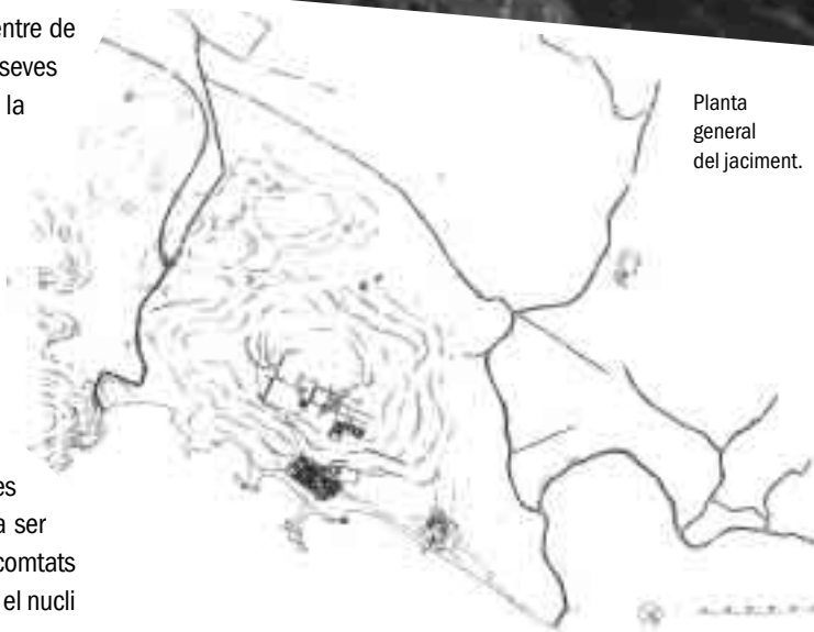
Planta general del jaciment.