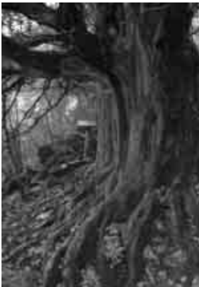
Espectacular teix declarat monumental a l'Orri (Alta Garrotxa).

tres, va diagnosticar que es tractava del fong Armillaria sp. En una primera etapa, aquest fong afecta les fulles i branques; més endavant podreix la fusta, i l'arbre acaba morint. La seva difusió es produeix d'una planta a l'altra per contacte d'arrels infectades amb arrels sanes. Com passa amb altres malalties, si l'arbre està debilitat és més propens a ser infectat. Segurament la sequera dels darrers anys ha propiciat el desenvolupament de la malaltia. L'especialista en malalties arbòries va proposar fer unes proves de podes en una part de la capçada dels arbres afectats per propiciar que els arbres puguin superar la malaltia. Al mateix temps se'n deixen altres sense tractament per tal d'avaluar els diferents resultats. Els tractaments s'aplicaran de seguida que arribin els corresponents permisos del Departament de Medi Ambient.