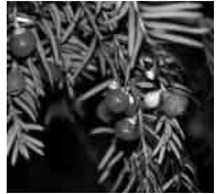
Fruits de Taxus baccata .

o en regressió; la regeneració hi és baixa, la qual cosa fa difícil la seva expansió. En aquestes zones caldria dur a terme actuacions silvícoles encaminades a afavorir la seva regeneració.