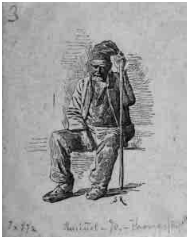
Tipos de la Vall de Ribas. Un jayo. Dibuix de Santiago Rusiñol com a il·lustració d'«Impressions de una excursió al Taga, Sant Joan de las Abadessas y Ripoll».

L'arribada al cim del Taga i la descripció dels efectes de l'alba des d'aquest mirador privilegiat formen sens dubte un dels passatges més intensos de la narració. Rusiñol descriu el viu cromatisme amb un reguitzell d'adjectius similars a la paleta de colors que emprava en les seves teles: «L'Orient va prenent una tinta rojenca y daurada, las lleugeras boyras que s'arrossegan per las planas se coloran dels tons més vius y prompte una corona de llum, una cascada d'or y pedras preciosas que sembla com que naix dintre lo mar, envia un raig de foch als pichs més alts del Pirineu. Insensiblement totas las muntanyas s'engalanan primer de rosa, en carní després y per fi en lila, la claror va creixent, y desde las més enlayradas carenas fins á