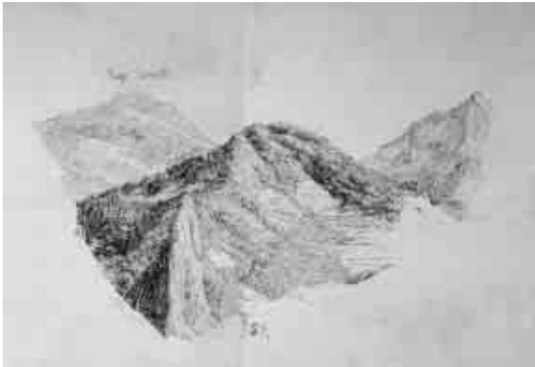
El Taga des de la vall de Ribes. Dibuix de Santiago Rusiñol com a il·lustració d'«Impressions de una excursió al Taga, Sant Joan de las Abadessas y Ripoll».

França i a Anglaterra.(5) La sensació d'estar llegint una narració escrita per una ploma culta reapareix novament quan Rusiñol enumera la llista d'obres que acull el monestir de Sant Joan de les Abadesses i en fa el comentari, procurant noves dades sobre possibles atribucions cronològiques, diferents a les fins llavors fixades. També és reveladora la seva indignació davant la visió de l'interior de l'església pintada de blanc amb les arcades de faixes grogues i blaves que ell considerava «esencia del mal gust»,(6) des d'un plantejament que mostrava la seva moderna filiació arqueològica.