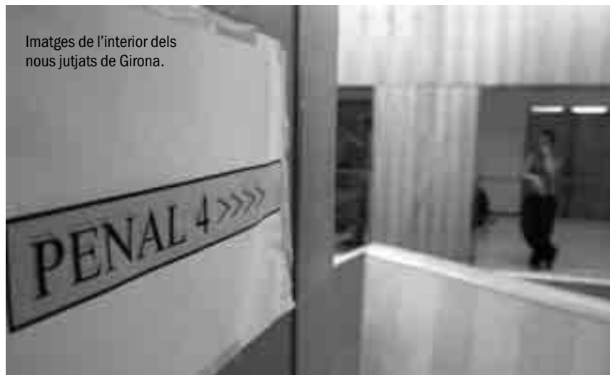
Imatges de l'interior dels nous jutjats de Girona.

Durant el segrest de M. Àngels Feliu, el poble, excitat, a la més mínima ocasió es congregava davant les portes del jutjat d'Olot i reclamava justícia,