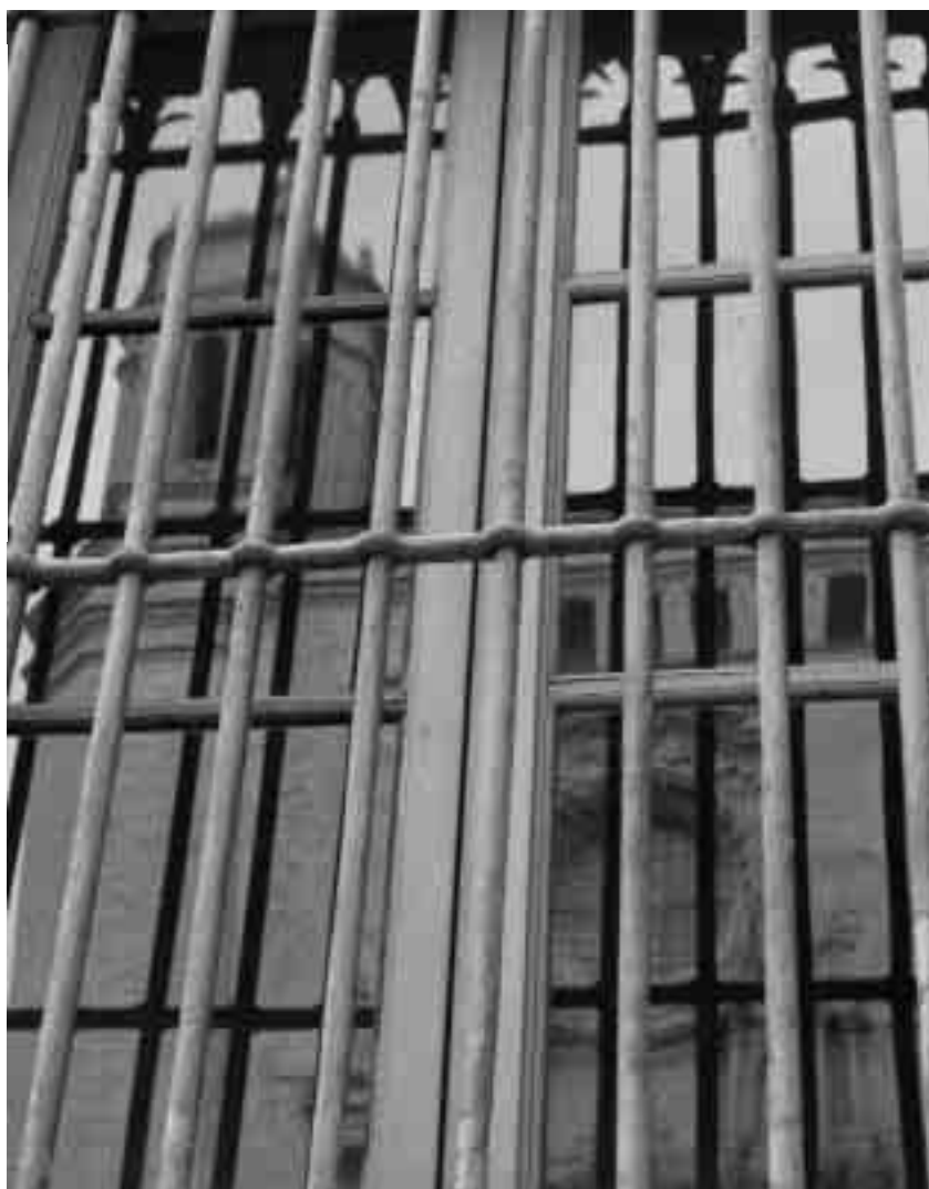
Finestra del Palau de Justícia de Girona, a la plaça de la Catedral.

Des del punt de vista dels jutjats provincials es planteja la pregunta de quina funció social tenen realment els tribunals. El concepte de província, com a topoi o prototip, s'exemplifica en les comarques de l'interior de Girona -Garrotxa, Ripollès, Cerdanya-, on encara es mantenen la proximitat i el control social. A províncies encara hi ha les persones; a la ciutat-metròpoli, són números i notícies. Els tribunals, encara que no funcionin per fer justícia, sí que compleixen amb una funció social: són els abocadors de les disfuncions socials. El jutjat és un receptor de tot el que va malament i que l'individu no sap o no pot arreglar o assumir. Els jutges han creat mecanismes d'autodefensa per no ser devorats per aquesta «brutícia».