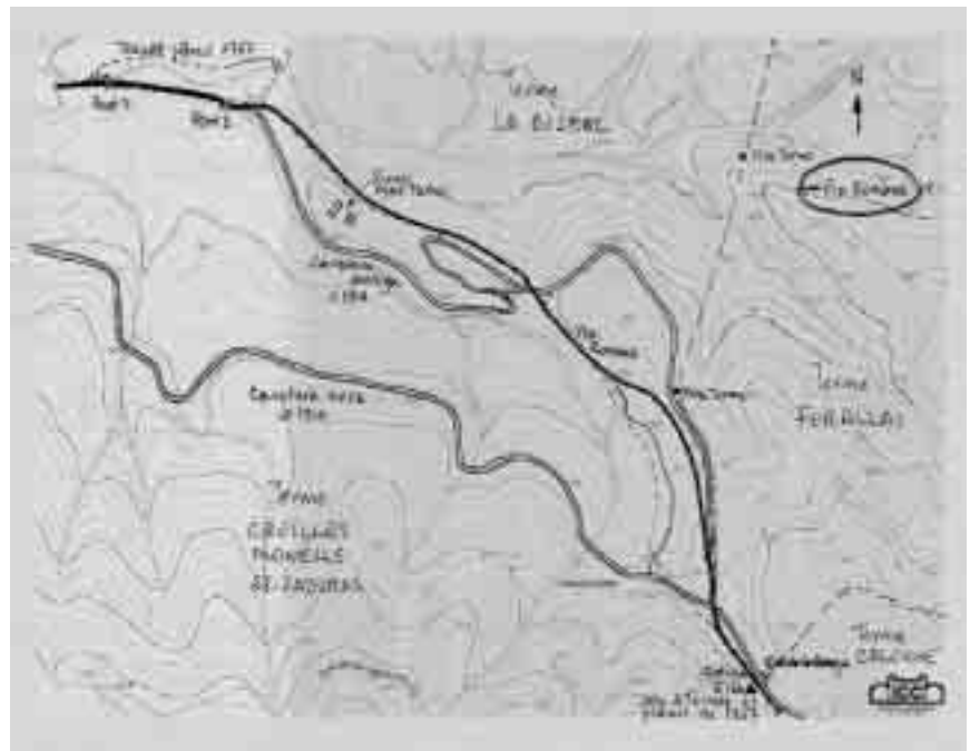
Situació de la via romana (en negre massís) en el vessant nord del coll de la Ganga en relació amb la carretera enquitranada actual (posterior a 1914) i la carretera antiga entre la Bisbal i Calonge. És una via romana rectilínia i equilibrada, tant en pendent com en direcció, en relació amb l'antiga carretera.

L'experiència de construcció de vies dels romans quan varen arribar a