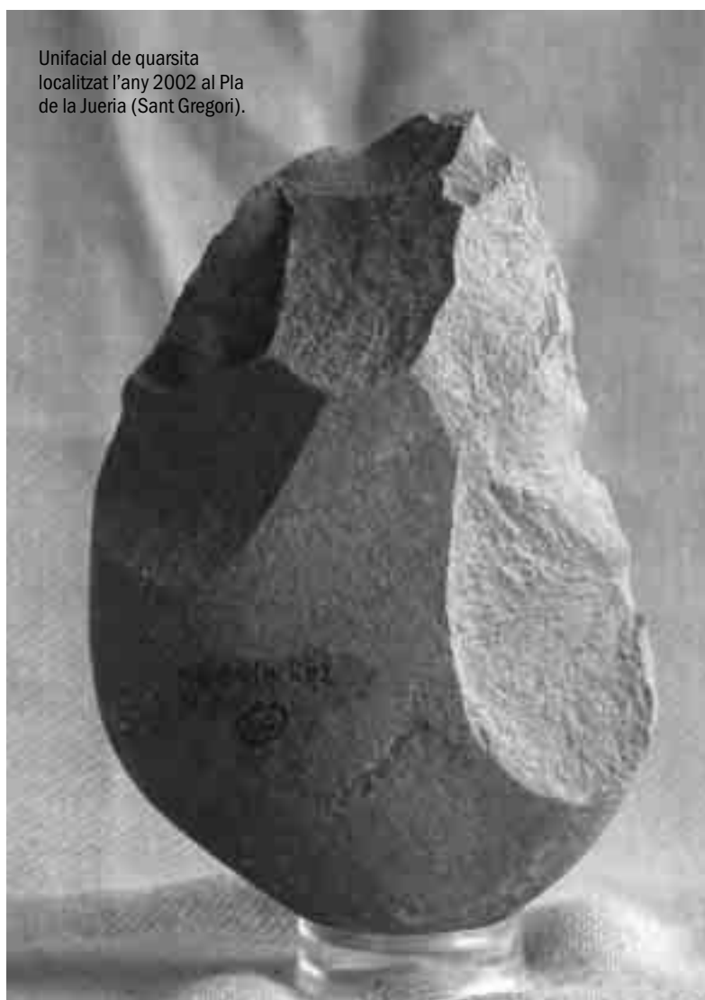
Unifacial de quarsita localitzat l'any 2002 al Pla de la Jueria (Sant Gregori).

Al promontori gironí del Puig d'en Roca –situat a pocs metres del pavelló de Fontajau–, s'hi van localitzar, a mitjan anys setanta del segle passat, nombrosos instruments de pedra que van ser atribuïts al paleolític inferior. Fins aleshores, aquesta etapa de la història de la humanitat, la més antiga de totes, encara no havia estat confirmada a Catalunya. Tot i disposar de proves irrefutables, els investigadors de les troballes del Puig d'en Roca van haver de fer front a corrents d'opinió escèptics, contraris, reticents, similars als que també havien sofert altres pioners que, a partir del segle XIX, van plantejar amb arguments científics qüestions relacionades amb l'origen i l'evolució de l'ésser humà o bé aquells que havien descobert fòssils humans i restes arqueològiques molt antigues. Tres dècades després del reconeixement del Puig d'en Roca, la situació del paleolític inferior a la bioregió de Girona ha canviat substancialment: s'ha passat de no saber-ne absolutament res a convertir-se en un dels registres a tenir en compte també a l'hora de comprendre l'arribada i posterior ocupació dels primers homínids a la península Ibèrica i al continent europeu.