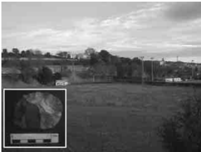
Les obres de construcció iniciades la tardor d'aquest 2006 al turó de la Bateria o al Puig d'en Roca III estan comportant la descoberta de nous instruments de pedra tallada pertanyent al moment final de l'acheulià o Mode Tècnic 2, com per exemple, el chopper de quarsita de l'esquerra de la imatge.

2004, assumir degudament totes aquestes dades que durant els últims decennis ens ha proporcionat la ciència requereix cert temps d'adaptació, perquè, de fet, els humans encara tenim el mateix cervell de l'home del paleolític i hem adquirit més informació de la que realment podem processar: «El cervell humà ha “produït” massa cultura i encara no l'hem assimilat. Fa cent cinquanta anys que es va inventar l'automotor i ja tenim reactors! Progressem geomètricament, però el nostre cervell és el de l'home del paleolític, molt conservador. I no podem pair d'una manera tan ràpida el progrés. Vivim immersos en tensions i conflictes provocats per situacions de greu desequilibri, perquè la humanitat no està ben adaptada al seu entorn. Les persones que habitem el món actualment som homes primitius que no estem prou adaptats a la societat moderna».