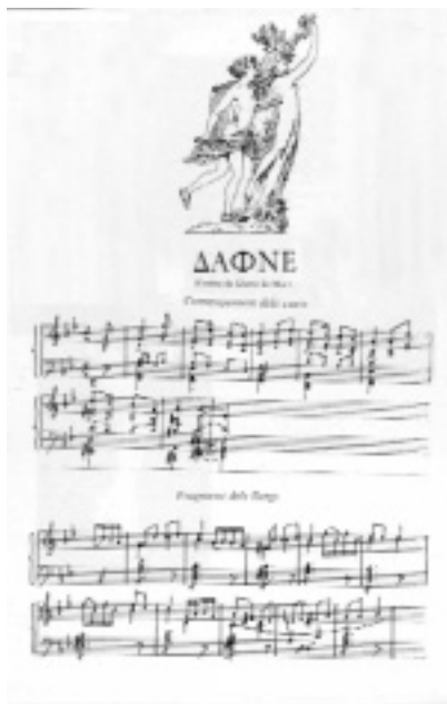
Partitura de la sardana El galanteig d'Apol·lo .