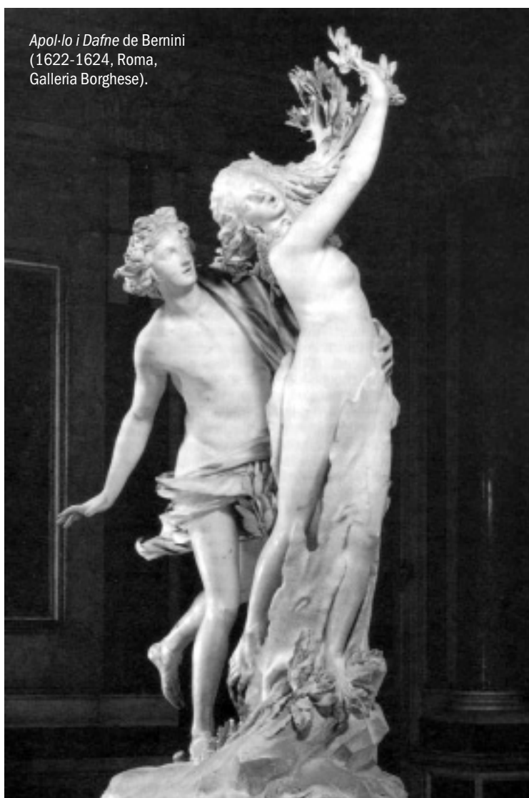
Apol·lo i Dafne de Bernini (1622-1624, Roma, Galleria Borghese).

El 1909 es descobria a Empúries una escultura romana d'Asclepi, que era considerat fill d'Apol·lo i déu de la medicina. La troballa arqueològica constituïa, sens dubte, una via ineludible per posar de manifest la vinculació de la cultura catalana amb el món clàssic. És precisament en aquest clima de recuperació del llegat grecoromà que va aparèixer la poesia de Josep Carner «Camperola llatina», recollida en la seva obra Verger de les galanies , que pretenia reivindicar també el lligam existent amb els antics. En aquest sentit, Carner converteix –realitzant una operació típicament noucentista– la figura d'una dona que treballa al camp en una estàtua majestuosa. Per això, la camperola s'apareix als ulls del lector com una dona «mig espellifada» i, a la vegada, «mig augusta». Al darrere del poema s'hi fa palesa, doncs, la intenció de crear una identitat nacional marcada per l'ascendent clàssic.