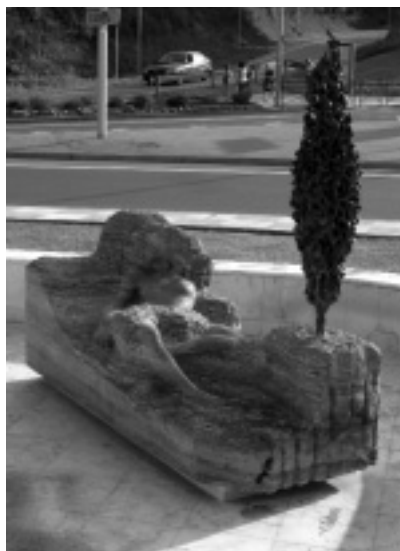
Escultura de Dafne feta amb marbre vermellós, que representa el color del sacrifici. Completa el monument el llorer de bronze al seu costat.