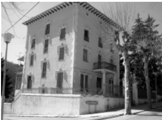
Villa Josefina, seu del futur balneari Font Vella, de Sant Hilari.

seves instal·lacions, en especial la zona de banys i tractaments, les habitacions i els espais de lleure. L'activitat del balneari Prats, possiblement el que té més història de Caldes de Malavella, es remunta a l'any 1840, en què la família Prats va començar a canalitzar l'aigua de la font de la Mina per tal d'oferir a clients i pacients les propietats curatives i de salut de l'aigua termal. Aquesta aigua emergeix a una temperatura d'entre 56°C i 60°C, i la seva composició mineralògica i química la dota de nombroses propietats curatives.