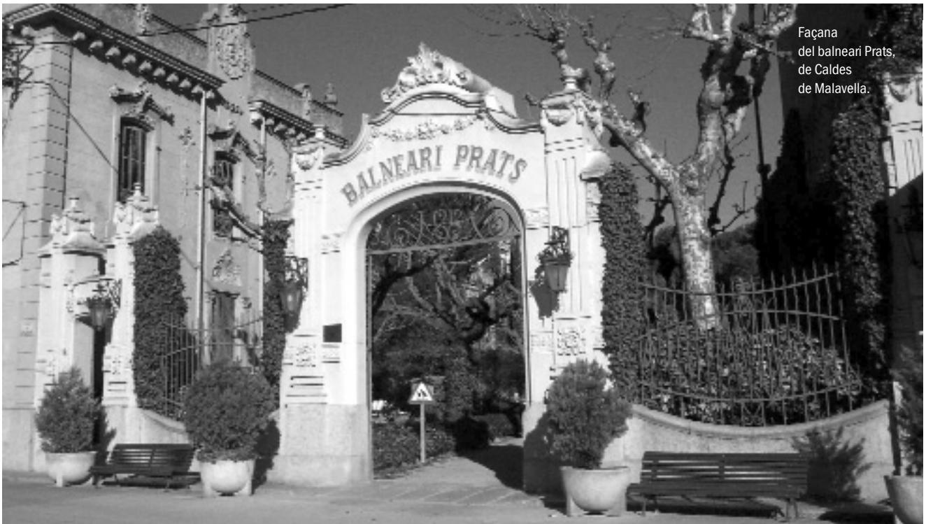
Façana del balneari Prats, de Caldes de Malavella.