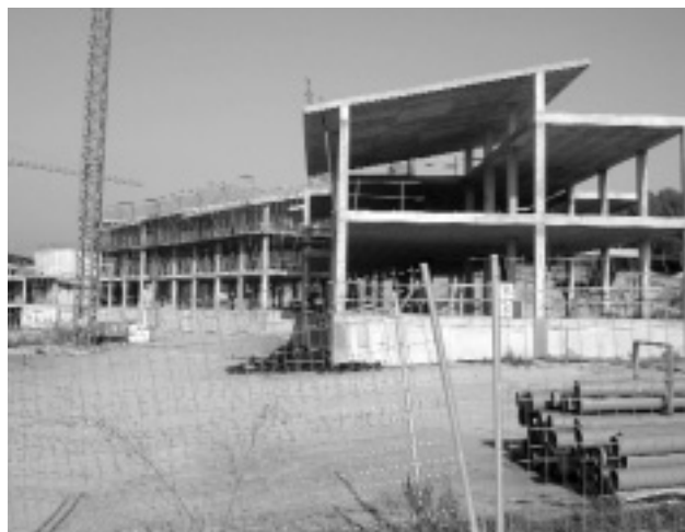
Obres del futur complex hotel·ler i termal de Jafre.

Tot i que pertany al municipi veí de Garrigoles, el pou d'aigua calenta o «el pou del petroli» és un dels indrets més coneguts i visitats i que més ha difós el nom de Jafre arreu del país. Aquest pou fou obert a mitjan anys seixanta per una empresa italiana que buscava petroli a la finca de can Quintana. En arribar a una fondària de prop de 1.000 metres van trobar aigua calenta i sulfurosa. Tot i que es va tancar la sortida, la pressió de l'aigua va ser més forta que el tap i el forat que servia de base a la torre de perforació es va convertir en una petita piscina de 2x3 metres. Naixia així la «bassa de Jafre», un