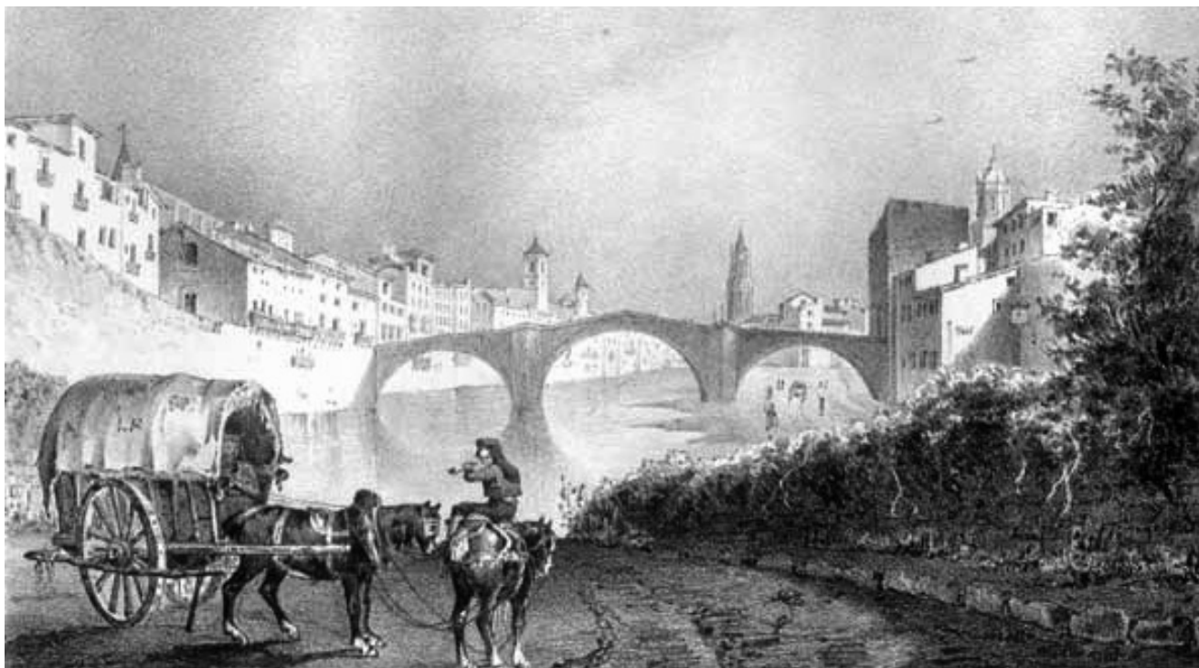
Vista parcial de Girona al principi del segle XX, en la qual es pot observar el llit del riu Onyar al seu pas per Girona i el desaparegut pont de Sant Francesc.

particular aprecio y el de cuantos le conocen por su bello carácter y excelente conducta.»