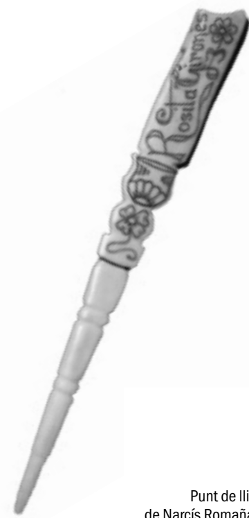
Punt de llibre, de Narcís Romañach.

El 28 d'octubre de 1943 arribà una carta del Govern Militar de Barcelona que deia: «De conformidad