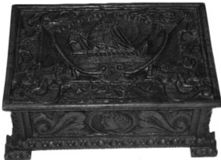
Capsa de fusta tallada, de Josep Batalla.

Sentència: «Secretario del Juzgado Municipal. De ideología rojo haciendo propaganda por el Frente Popular y siendo apoderado de Izquierda Republicana. Durante el periodo rojo fue secretario del comité de guerra y