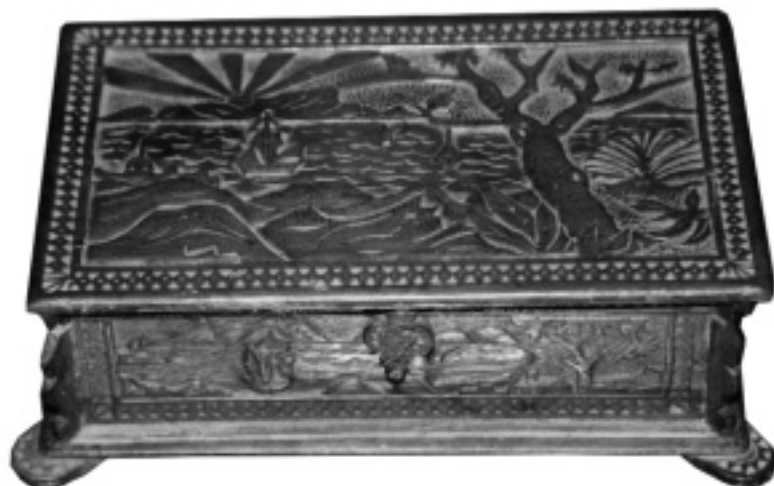
Capsa de fusta, de Josep Pujol.

Va ser condemnat a 20 anys de presó. El 31 de juliol de 1944 li fou commutada la pena per 12 anys de presó. Va morir el 27 de desembre de 1940 a la presó de Figueres. No havia tornat a veure la seva família ni els seus fills.