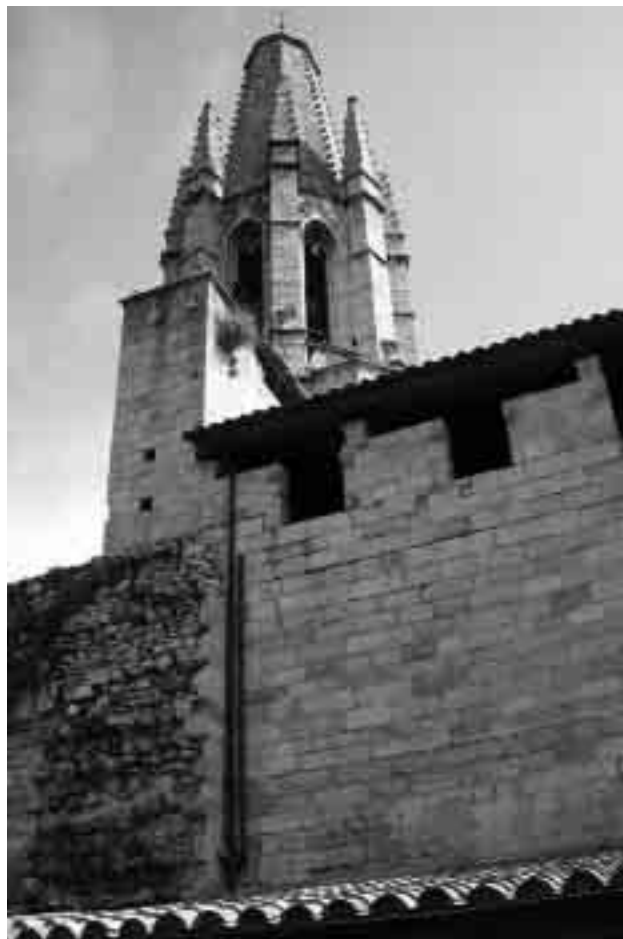
Campanar de l'església de Sant Feliu.