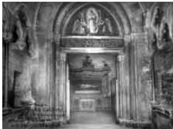
Entrada sud a l'església de Sant Feliu de Girona.