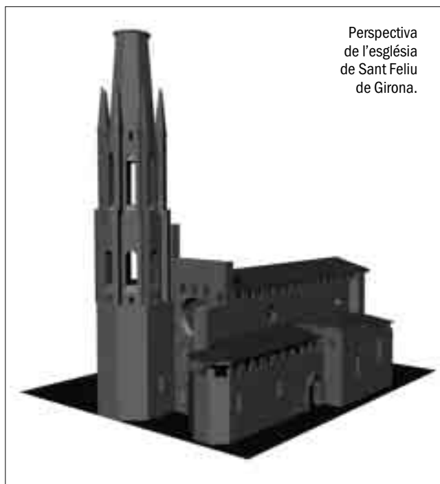
Perspectiva de l'església de Sant Feliu de Girona.

bla que s'esmenta, de forma indirecta, la catedralitat, i per tant la gran importància que tenia el temple de Sant Feliu de Girona. Aquestes referències arriben fins el segle XI. Les dades documentals i arqueològiques donen la prioritat a Sant Feliu com a església catedral, i ho referma el fet que no s'hagin trobat vestigis de l'antiga catedral preromànica durant les excavacions a la catedral.