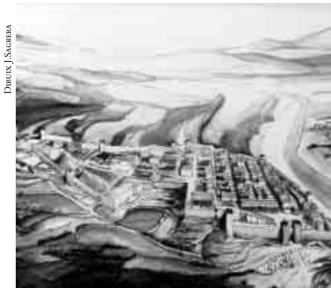
Restitució ideal de la ciutat de Gerunda al segle III, vista des del nord.

Aquesta regularitat es va haver de sobreposar a un solar poc adequat, marcat per un fort pendent est-oest i per un orografia