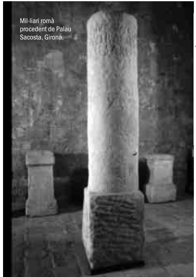
Mil·liari romà procedent de Palau Sacosta, Girona.

La ciutat que havia nascut com a fortalesa, amb voluntat de dominar el vell i extraordinàriament important camí d'Hèracles, després Via Augusta, havia deixat pas, com a conseqüència de la llarga etapa de pau que va obrir el principat d'August, a una situació diferent on les activitats agrícoles i ramaderes i l'intercanvi