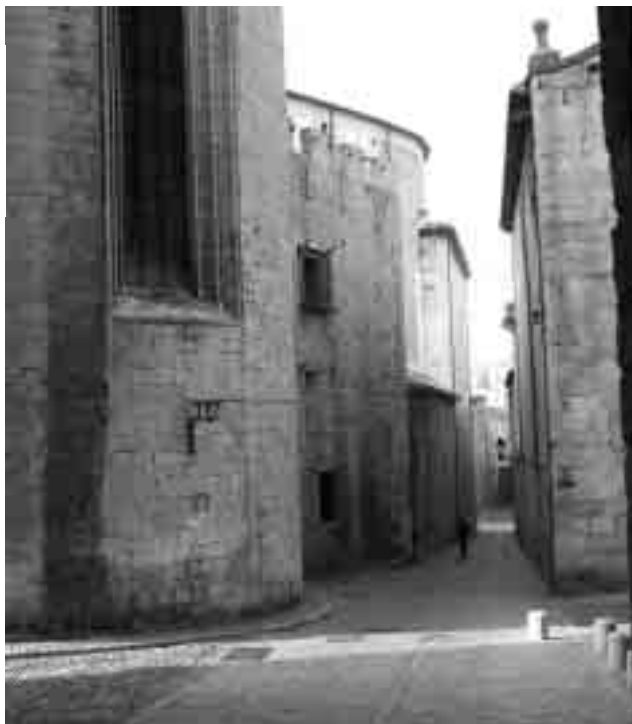
L'antiga necròpolis cristiana estava situada en una àrea propera a la porta nord de la ciutat romana, als peus de la via Augusta, a tocar l'actual Carrer del Llop.

caps de pont, guals, ports, i novament fortificades era essencial. No totes van entrar en aquest joc; algunes perquè no els calia i d'altres perquè no podien. Gerunda, recordem-ho, refermà i modernitzà les seves muralles d'acord amb allò que disposaven les normes més actualitzades de la poliorcètica. Era la ciutat qui pagava l'obra. En aquest cas, es va fer servir a bastament material d'aprofitament procedent de vells edificis, especialment funeraris, per construir els nous murs. Allò que se'n conserva, menys del que voldríem i menys del que hem suposat durant molts anys, denota l'acoblament i incorporació de la muralla fundacional, on era factible, i una cura especial en la defensa de les portes de la ciutat amb l'afegit de poderoses torres quadrangulars.