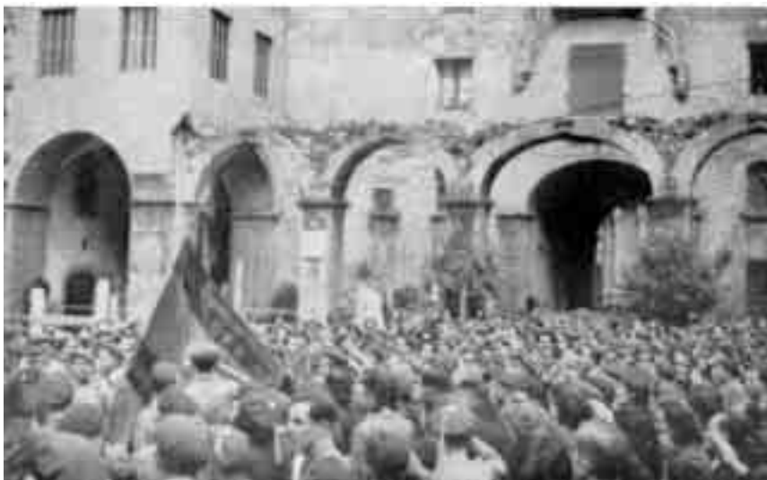
Acte del lliurament de la bandera del Terç de Montserrat al santuari, la tardor de 1939.

mancaven. En començar el 1938, amb 400 homes, el Terç fou traslladat al front de Guadalajara. Es va decidir que després de la guerra la seva bandera fos dipositada a Montserrat. El març disposava ja de set-cents voluntaris. El juliol van ser enviats a Extremadura, però el dia de sant Jaume foren transferits urgentment a l'Ebre, on la República havia iniciat un atac. El crit fou unànime: «Anem a Catalunya!». «Arribarà l'hora tan anhelada pel Terç de Montserrat, ja que d'aquesta manera els requetès els sembla que cooperaran més directament en l'alliberament de les seves llars».(10)