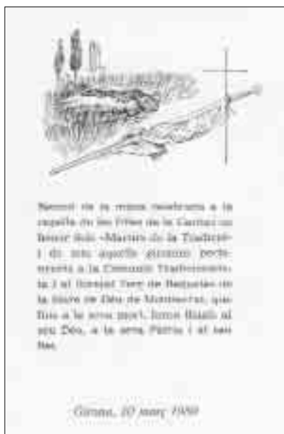
Estampa distribuïda l'any 1989 en la missa en sufragi dels gironins morts en el Terç de Montserrat.

Catalunya, el 23 de desembre de 1938. No deixa de ser sorprenent (o no) que en aquell precís moment fos traslladat a un destí tan llunyà com Extremadura. En les ribes del riu hi havia deixat 164 morts i 700 ferits.