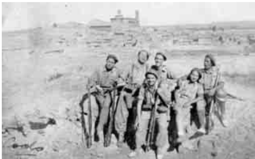
Un grup de requetès catalans als afores de Codo, dies abans dels sagnants combats de l'estiu de 1937.

Ben aviat s'adonaren que la realitat política amb què havien topat no era precisament la que esperaven, i que pel fet de ser catalans eren vistos amb