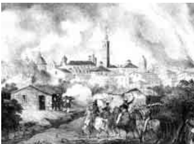
L'Expedició Reial arribà als murs de Castelló (juliol 1837)