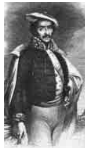
Cabrera, exhaltat com a comte de Morella en un gravat dels primers anys de la Guerra

cament parlant, és prou a prop com per despertar recels i encara no és prou lluny per veure'l objectivament. Però tots sabem que ha estat i seguirà sent un dels segles més convulsos de la nostra història. Ple de guerres i canvis socials, polítics i econòmics. Dins d'aquest marc no és gens estrany que sobresurtin personalitats rellevants que, sigui per la singularitat del moment o fruit de l'atzar, deixaran empremta en la història. Un cas d'aquests és el seminarista de Torto-