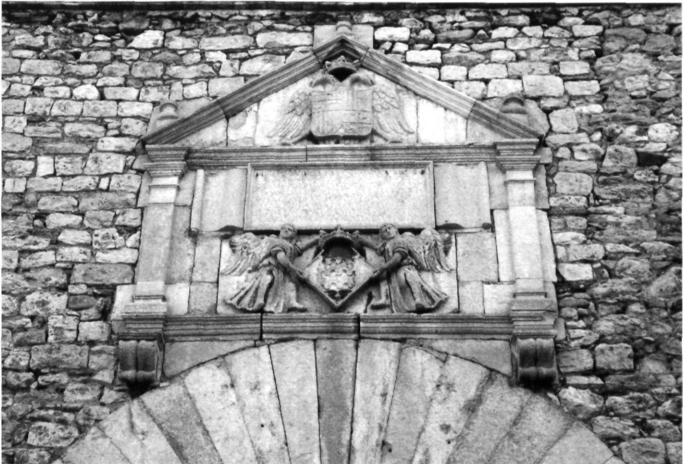
Detall de la façana principal de Les Àligues, primera seu de l'Estudi General de Girona.

Després d'aquest primer intent fracassat i davant la impossibilitat d'obtenir els fons necessaris per engegar aquesta iniciativa, les autoritats gironines i el capítol de la catedral van veure en la protecció papal l'única opció per crear la seva universitat. Aquí apareix la figura de Joan Margarit, el gironí internacionalment més influent de tots els temps, com va encertar a definir-lo Joaquim Nadal.(2) El bisbe gironí residia aquells anys a Roma i era l'home ideal per negociar la protecció del papa Pius II.