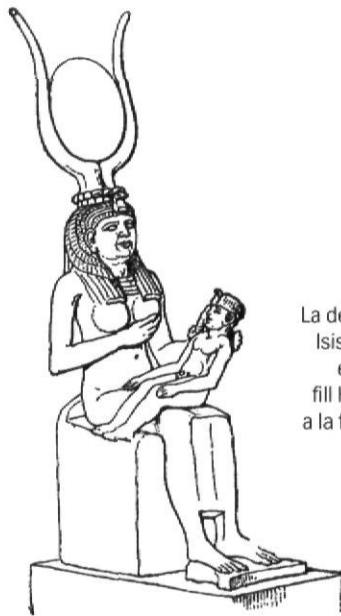
La deessa Isis amb el seu fill Horus a la falda.

En alguns casos, un cop s'ha trobat la imatge, aquesta mostra la seva gratitud amb un miracle o fet prodigiós. Tenim el cas de la Mare de Déu de l'Om, on la Verge retornà la parla a una noia muda de can Parramon de Ventalló mentre pasturava la bouada en els prats de Pelacalç, parròquia unida avui a la de Montiró, en el municipi de Ventalló. La pastoreta va trobar aquella imatge damunt la soca d'un om mentre buscava un bou que s'havia escapat, i la marededéu va informar a la noia que trobaria l'animal