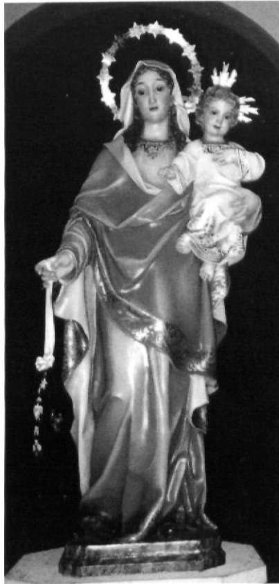
Imatge actual de la Mare de Déu de l'Om, a Ventalló

A les comarques de Girona, en alguns casos les marededéus trobades