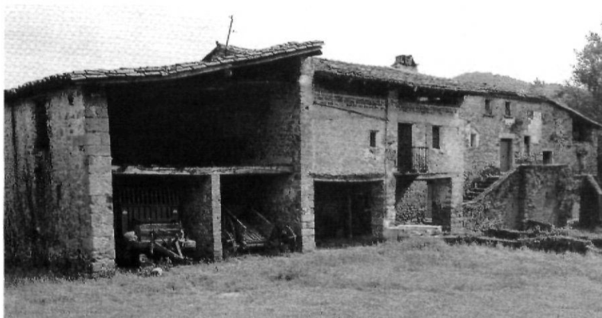
El Mas Planadevall, a Santa Pau.

Tant el culte d'Isis com el de Cibele es van difondre per tot Europa, i a les nostres terres se'ls van aixecar diferents santuaris. En tots dos