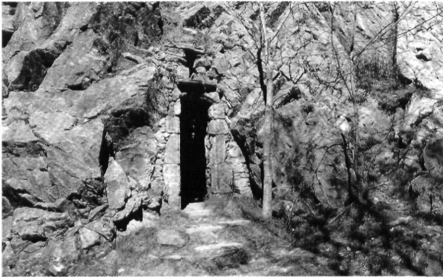
Cova on va ser trobada la imatge de la Mare de Déu de les Salines.