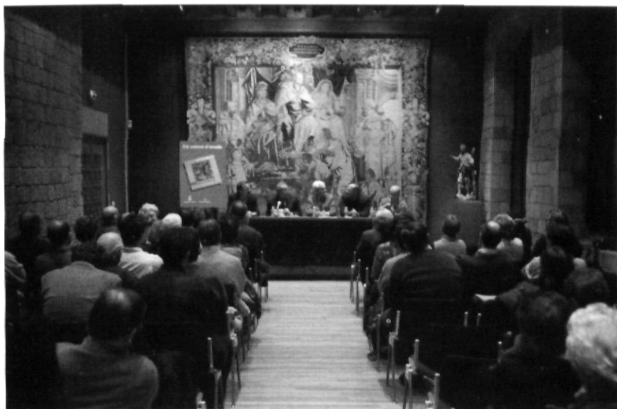
Presentació d'un Quadern a la Fontana d'Or de Girona.

El 1988, Bover detectà alguns buits importants en les monografies, referents a poblacions grans o zones concretes, però les llacunes s'han anat omplint amb el temps, tot i que n'hi ha que encara «clamen al cel», com diu Sapena. Domènech destaca que la política editorial dels Quaderns ha estat alternar les poblacions grans amb les més petites —en canvi, Fabre reconeix que s'intentà cobrir primer els grans municipis—, per no discriminar conscientment a ningú, a més de garantir que es publicuessin títols de poblacions actualment menors però de gran importància històrica en el passat. Progressivament, doncs, s'ha anat teixint la densa trama de la història de les comarques gironines, i això s'ha anat fent paral·lelament a la revifada de la història local catalana, la qual ha tingut lloc des dels anys setanta. La col·lecció mateixa és tant el resultat de la història