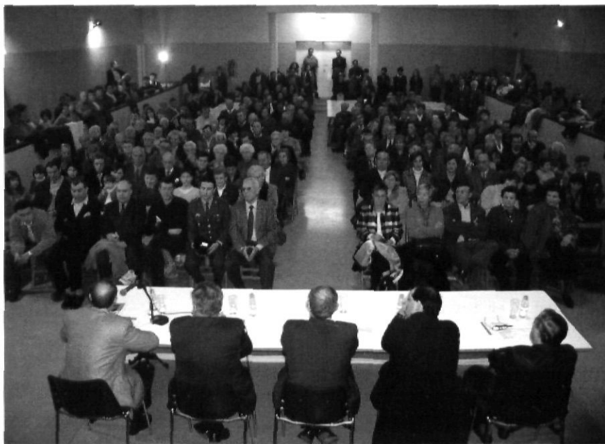
Sovint les presentacions dels Quaderns gaudeixen d'una gran assistència de públic.

En aquells primers moments, Fabre —que era una mena «d'empelt perfecte entre l'historiador i el periodista», segons Sapena— caracteritzà la