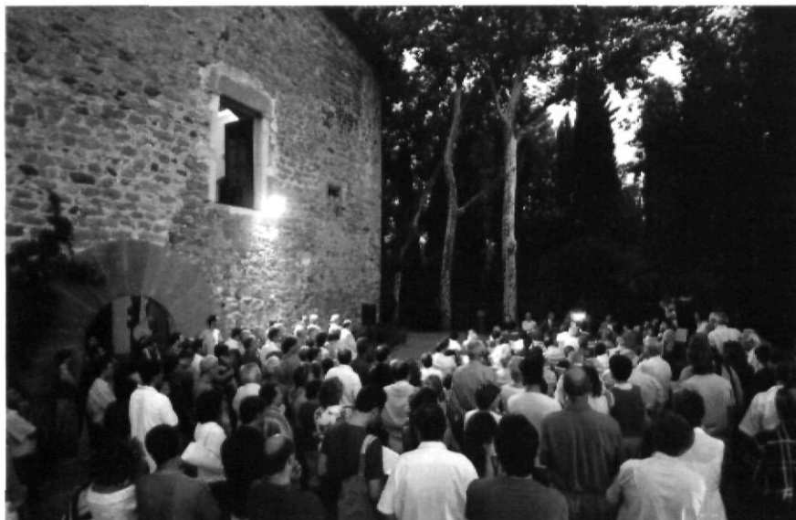
Acte de presentació de la monografia sobre la Pera.

local gironina com la seva impulsora, ja que ha creat un model vàlid per als Quaderns editats a Girona (1987), Olot (1991), Palafrugell (1993), Figueres (1997) o Banyoles (1999), per exemple. Cal destacar la gran demanda de treballs d'aquest tipus per part dels ajuntaments, que ha estat satisfeta, en part, amb l'edició de les monografies corresponents dins la col·lecció dels Quaderns. En alguns casos s'ha tractat de municipis que no tenien cap llibre d'aquestes característiques, i les presentacions del títol corresponent s'han convertit en tot un esdeveniment local.