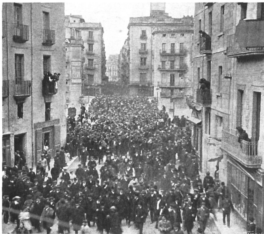
La comitiva, al seu pas pel carrer Nou i el pont de Pedra.

El mateix dissabte a la tarda una comissió formada per Francesc Cambó, Miquel Junyent (carlí) i Joa-