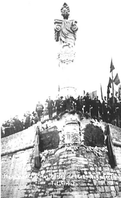
Al peu del monument als setges de 1808-1809.

de Ter. Mentrestant, a la fonda del Comerç l'artista Santiago Rusiñol, germà gran del president de la Lliga, eternitzava els postres dels dirigents solidaris amb dites i contes, segons La Lucha : «gran ironista y escelente causeur consideraba de mucha mayor trascendencia la amable sobremesa que el mitin, el acto y los manifestantes y oradores» (13/II).