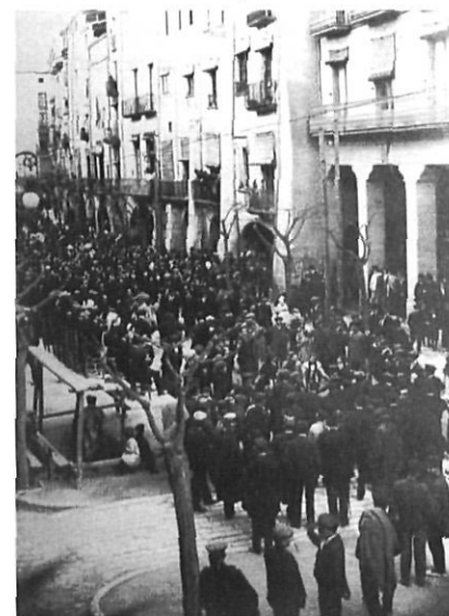
Sardanes a la Rambla en honor dels participants en el miting.

Els visitants ompliren totes les fondes i cafès de la ciutat, mentre esperaven el moment que comencés l'acte de la tarda. Després de diverses temptatives, els organitzadors aconseguiren que se'ls cedís la plaça de braus, llavors situada al municipi de Santa Eugènia