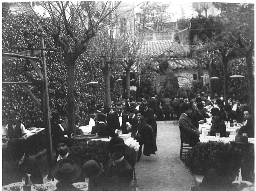
Dinar de diputats i oradors a la Fonda del Comerç.

cipal. Amb prou dificultat aconseguí arribar a la porta i, en obrir un ventall, la gentada «entrá com onada potent dintre'l teatre, que quedá plè en un instant» ( La Veu , 12/II). Amb l'arribada de la guàrdia civil s'ocupà militarment l'accés al local i es prohibí l'entrada a la gentada que encara quedava sota els porxos de la plaça. Amb l'aparició dels oradors a l'escenari s'encengueren els llums i ressonà