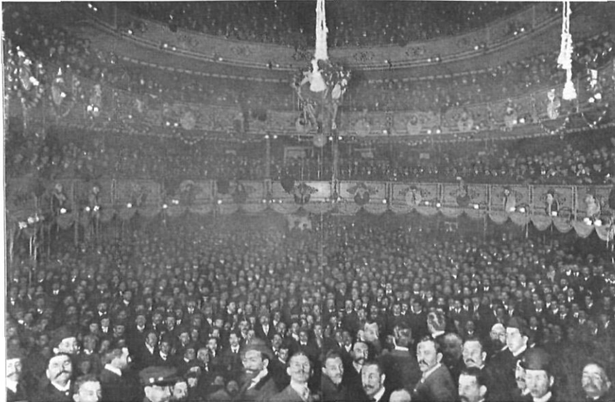
Celebració del míting al Teatre Principal.