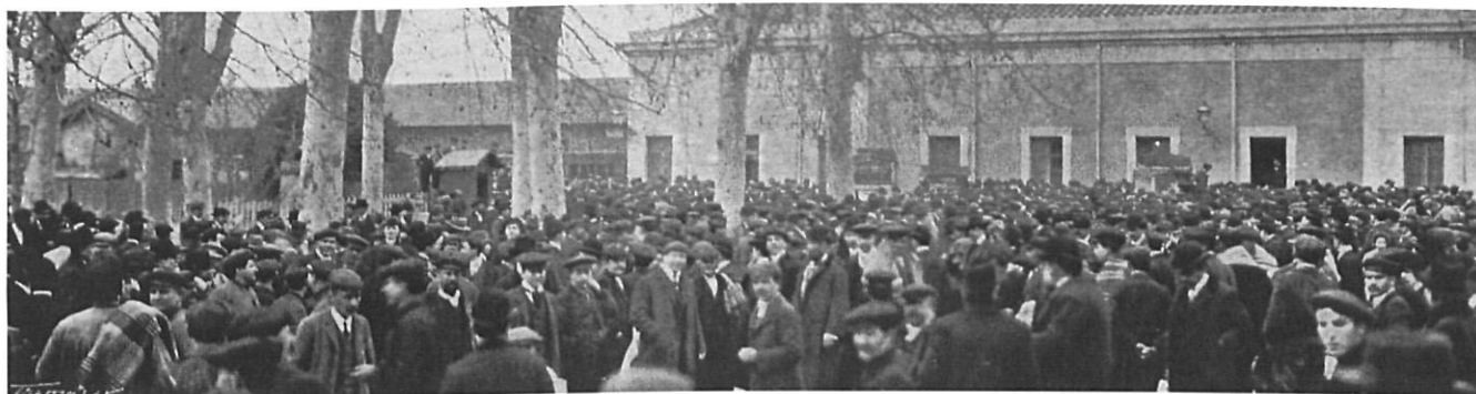
LA IL·LUSTRACIÓ CATALANA, BC

Senadors, diputats i expedicionaris arriben a l'estació de Girona per assistir al míting de Solidaritat Catalana.