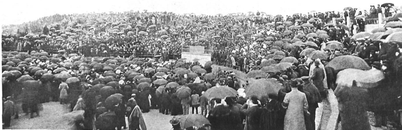
La concentració a la plaça de braus, interrompuda per la pluja.