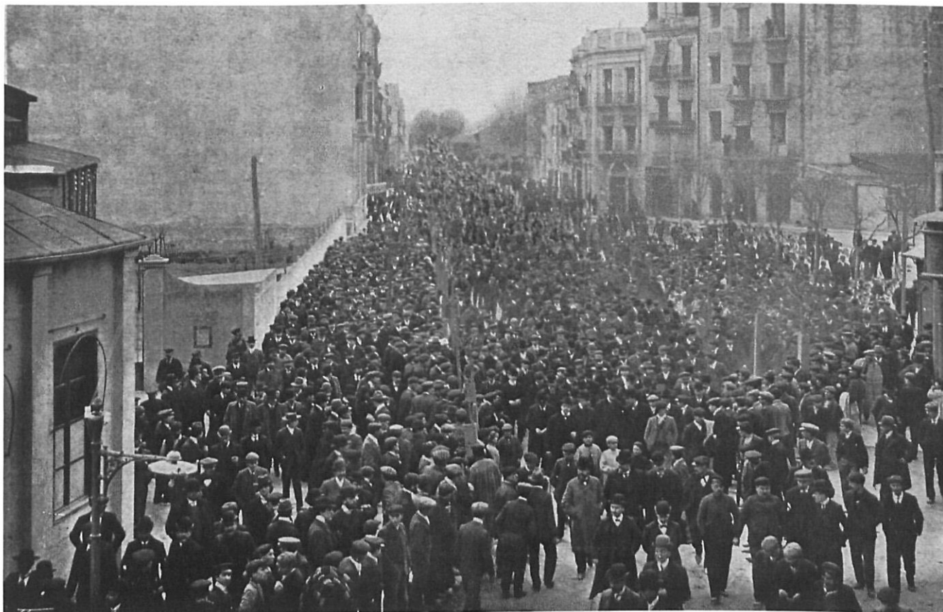
LA IL·LUSTRACIÓ CATALANA, BC

El pas dels manifestants per la carretera de Barcelona