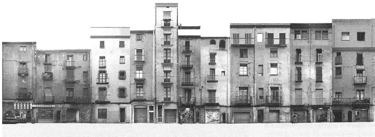
Carrer de la Cort Reial. Façanes ortorectificades.

comunitaris, d'activitat, els d'equipaments públics i privats i els d'obres. Dels restants, es considera que corresponen a habitatges buits quan registren consums nuls per un període mínim de tres mesos.