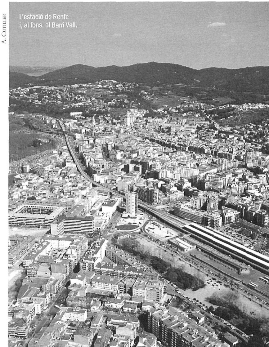
L'estació de Renfe i, al fons, el Barri Vell.