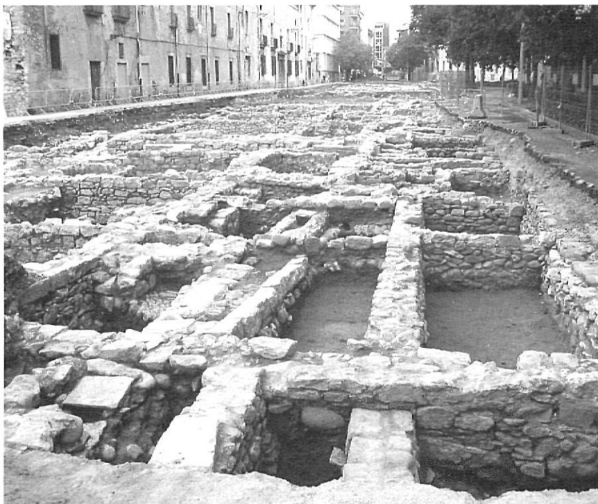
Les cases del carrer de l'establiment de Savaneres ocupaven la part central de l'actual carrer Pompeu Fabra.

Amb aquest objectiu es va signar un conveni de col·laboració entre GISA i l'Institut del Patrimoni Cultural de la Universitat de Girona per realitzar aquesta investigació. L'estudi arqueològic es va dur a terme en gran part durant el 2005, paral·lelament al llarg procés burocràtic d'adjudicació de l'obra, de tal manera que les excavacions havien de finalitzar abans de l'entrada de l'empresa concessionària. Els treballs varen acabar el mes de setembre de 2005, un mes abans de la resolució del concurs de l'obra, i quedaren pendents alguns sectors que no es varen poder estu-