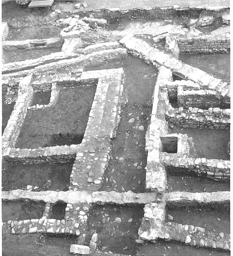
En tot l'establiment solament hi havia un petit carrer nord-sud (al centre de la imatge).

Al segle XVIII es va construir el darrer dels edificis que donaren forma al sector i especialment la nova plaça de l'hospital, l'hospici i Casa de Misericòrdia, actual Casa de Cultura, que, concebuda arquitectònicament com l'element que havia de donar la rèplica a l'edifici de l'hospital, tancava per tramuntana la plaça i definia un dels espais emblemàtics de la ciutat. En aquest període i al llarg del