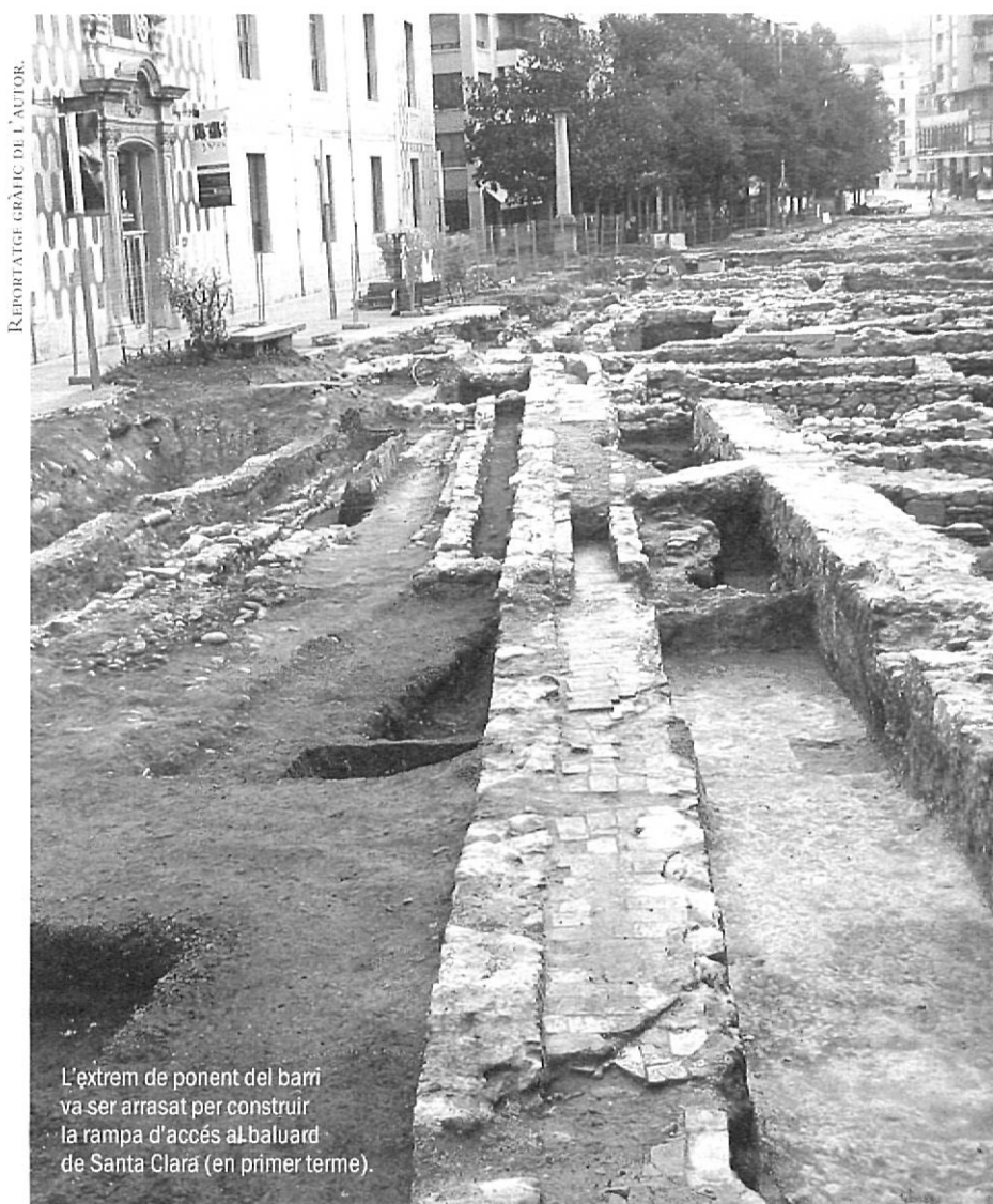
L'extrem de ponent del barri va ser arrasat per construir la rampa d'accés al baluard de Santa Clara (en primer terme).

Les obres de reforma de l'antic hospital de Santa Caterina de Girona per convertir-lo en la seu dels diversos departaments de la Generalitat de Catalunya a la ciutat han permès realitzar l'excavació arqueològica més extensa que s'ha desenvolupat mai a la ciutat de Girona. Aquesta ha posat al descobert part d'un establiment que des d'època medieval formava part del barri del Mercadal i ajudarà a reconstruir la història de la ciutat a partir d'un dels seus barris perifèrics, i per tant, d'un dels barris que primer patien els sotracs tant econòmics, com socials, com militars de la ciutat.