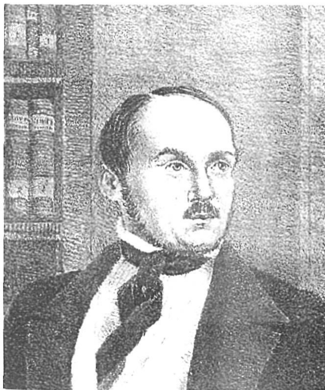
Esteve Paluzie (Olot 1806 - Barcelona 1873).

en l'anomenada «estamperia econòmica» traient làmines de soldats i de decorats destinats a teatrets de joguina d'una gran acceptació popular.