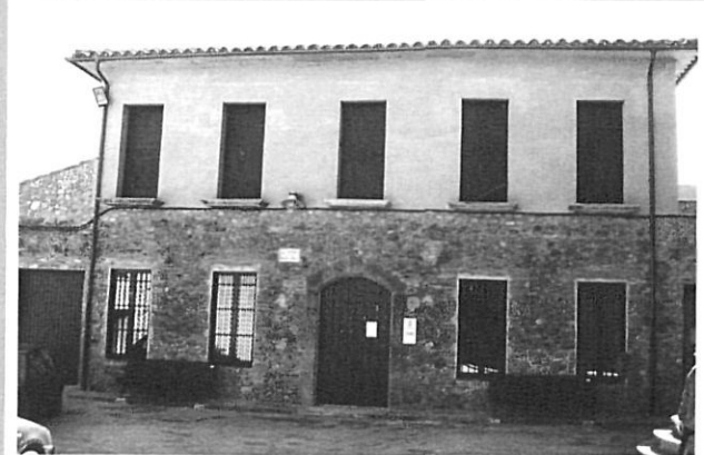
Escoles de Colomers. 1959. Autor desconegut.