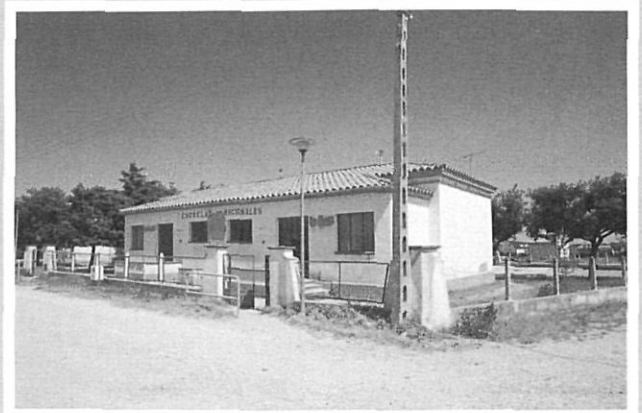
Escoles de Navata. EEI Els Belluguets 1953. Autor desconegut.