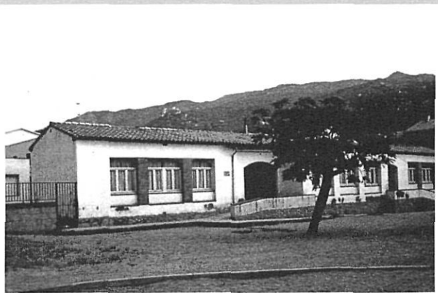
Escoles de la Bisbal. CEIP Joan Margarit. 1964. Josep Claret Rovira.