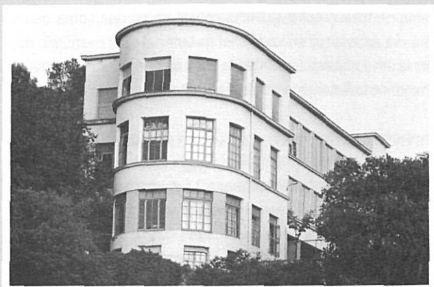
Escola Ignasi Iglésias. Girona. 1931-33 R. Giral.