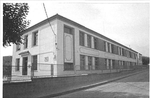
Escola de Sant Feliu de Guíxols. CEIP Gaziel. 1934-37 R. Sánchez Echevarría.

A Catalunya aquesta voluntat política es manifestava en el fet que el govern de la Generalitat creava l'Escola Normal amb caràcter d'assaig pedagògic per incidir en la formació inicial del magisteri; tres instituts-escola i, al mateix temps, potenciant-les, relançava les Escoles d'Estiu com una eina indispensable de formació permanent del professorat.