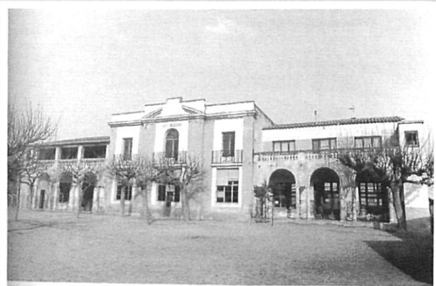
Escoles de Sant Jordi Desvalls CEIP Sant Jordi. 1932-33. Emili Blanch.