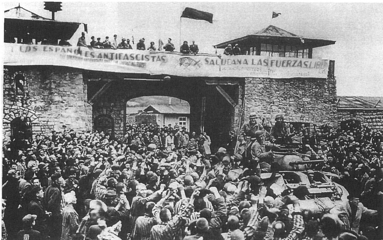
El rètol en llengua castellana que donà la benvinguda a les forces americanes que van alliberar el camp de Mauthausen el 5 de maig de 1945.

Com hi havien arribat? La majoria eren membres de l'exèrcit republicà que després de la retirada de Catalunya, l'hivern de 1938-1939, restaren internats en els ignominiosos camps del sud de França. Els noms d'Argelès-sur-Mer, Saint Cyprien, Gurs, Bram, Agde, etc., abans d'esdevenir els centres turístics que són actualment van ser referents per a més d'un quart de milió de combatents republicans en derrota que van ser traslladats a aquells espais de platja, envoltats de filferrades i controlats per guàrdies mòbils i tropes senegaleses. «Ni camps d'extermini, ni camps de treballs forçats, aquests acolliren 250.000 milicians considerats molt molestos, pel fet de ser republicans i espanyols».(2) Hi van restar fins a l'esclat del segon conflicte mundial, el primer de setembre del 39, quan van ser reclutats, a la Legió francesa o incorporats a les Compañies de Treballadors Estrangers. En produir-se la derrota de l'exèrcit francès, el juny de 1940, van ser considerats inicialment presoners de guerra, fins, que en un moment donat, el govern de Madrid els declarà «apàtrides» i deixaren aquells camps dits stalags per ser transferits als de concentració, els temibles konzentrationsstalags .