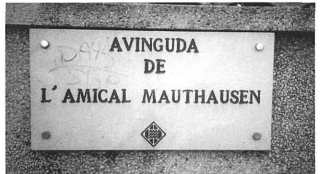
Un discret carrer de Girona, dedicat a l'Amical Mauthausen.

Precisament l'obra de la malaguanyada escriptora va ser un referent en aquesta reivindicació de la memòria dels catalans exterminats pels nazis. Artur London en el pròleg reivindica aquesta necessitat: «La nostra tasca, la dels periodistes, dels escriptors, dels artistes, és aclarir les zones fosques de la memòria col·lectiva dels nostres pobles».