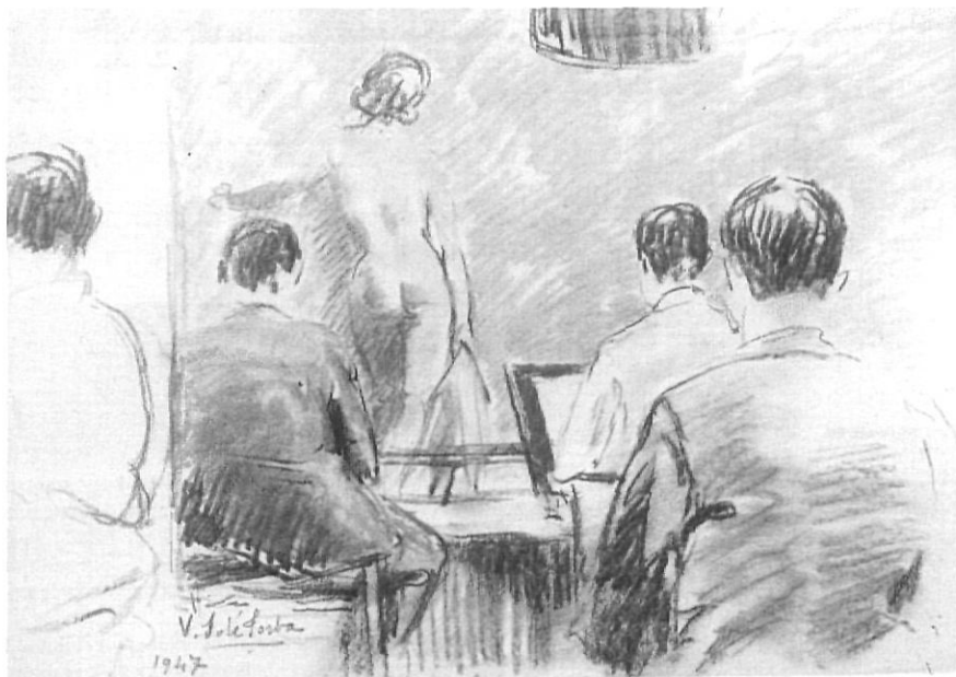
Alumnes treballant a la classe de natural (dibuix de 1947).