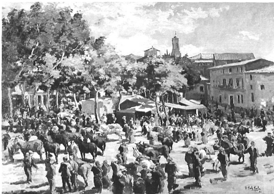
Mercat al Firal d'Olot (oli de 1934).

Com a deixeble d'Iu Pascual i seguidor de la pedagogia dels germans Vayreda, dominava el dibuix i els seus treballs traspuen l'escola de la qual havia rebut lliçons, però no se'l troba lligat als canons d'un mestratge concret, sinó que la seva personalitat es manifesta lliure de patrons ances-