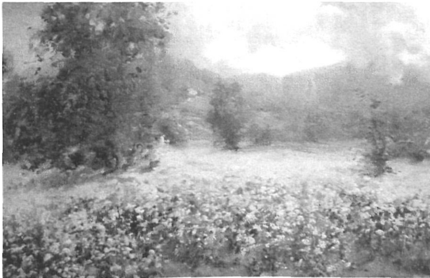
Camp de fajol (oli de 1944).

trals. Es deia d'ell que era «únic i irrepetible» i que la seva paleta cercava colors propis i els oferia. Transmissor de sentiments i emocions com els nostres paisatgistes, evocava el que veia amb entusiasme en un espai de temps concret i mutant a la vegada.