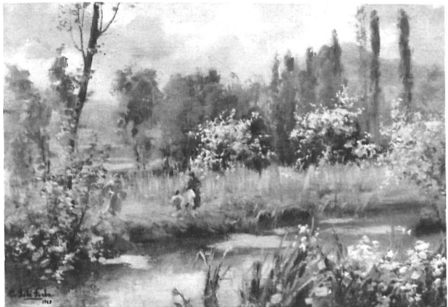
Paisatge (oli de 1942).