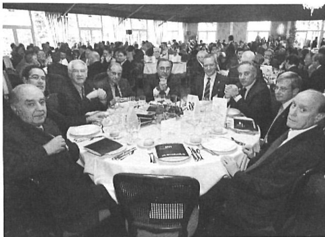
Dues panoràmiques del dinar multidinari de Peralada.

Girona, deia en l'opuscle esmentat que era en l'àmbit local on s'havia produït la veritable transició, perquè «les eleccions de 1979 van trencar els motlles i van esbantar les portes de la democràcia amb l'accés a la gestió municipal de representants de tot l'espectre polític». A l'acció decisiva jugada pels partits en aquest procés, Enric Matarrodona, president del Col·legi de Periodistes, hi afegia la que van dur a terme, entre 1977 i 1979, «les associacions de veïns i les comissions de control municipal, els components de les quals, en molts casos, van acabar nodrint els ajuntaments democràtics».