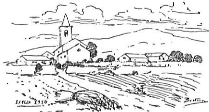
Un dibuix a la ploma de Bertrana.