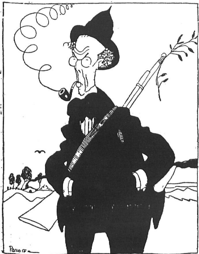
Bertrana caçador, en el dibuix de Passarell que il·lustrava La feta del mussol .

na descriu el moment d'anar a agafar el tren per anar a estudiar a Barcelona, i l'escriptor fixa l'atenció del lector en un vol de perdius que ja no podrà caçar. L'envaeix una forta enyorança d'aquest plaer, representatiu de la manera de viure i veure el món que deixa enrere.(2)