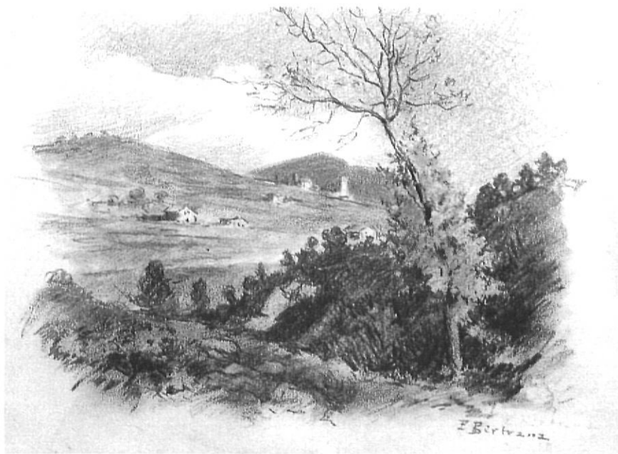
Un paisatge rural dibuixat amb llapis per Bertrana.

El conte es publicà a l' Almanac de Catalunya el 1929, i no ha estat reeditat des de llavors. La revista, que sortí per primera vegada al principi de 1926 i es reprengué els anys 1929 i 1930, formà part de les moltes publicacions aparegudes durant la Dictadura de