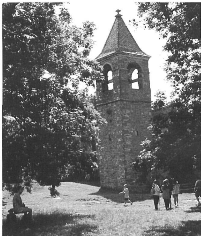
El campanar de Cabrera.