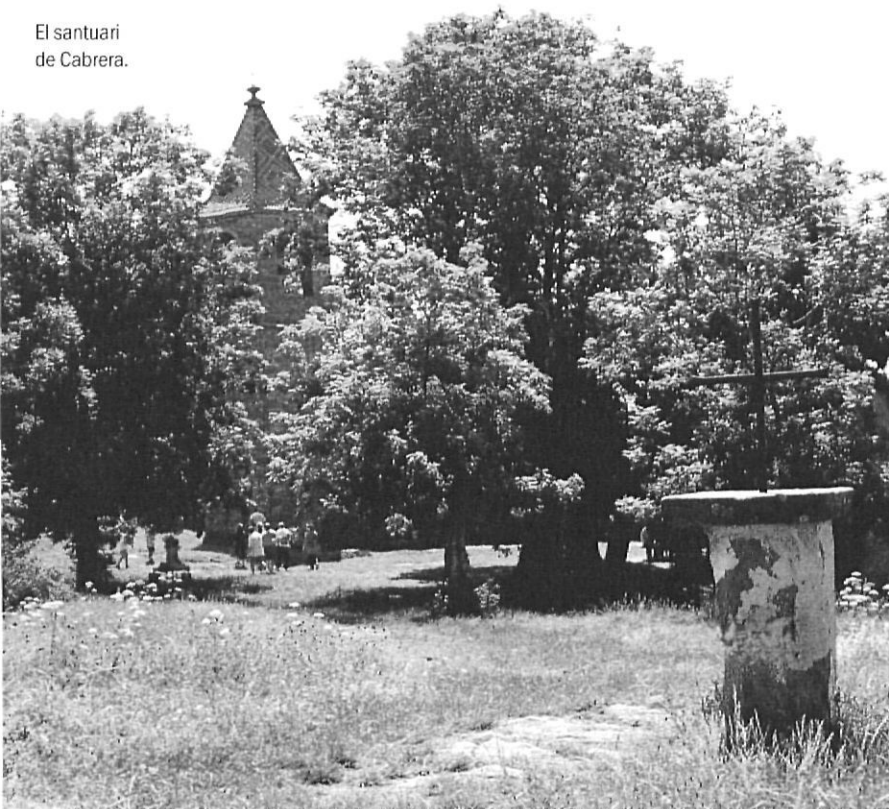
El santuari de Cabrera.