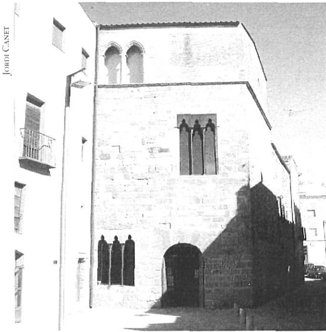
La Cúria o Cort de l'Audiència fou el centre administratiu i judicial del comtat. A la planta baixa hi havia la notaria dels comtes i a la planta superior l'arxiu comtal.

Arran de l'esclat de la Guerra dels Segadors, i per prevenir qualsevol destrucció de documents, l'any 1641 l'arxiu fou traslladat a la ciutat andalusa de Luceña, capital de l'estat de Comares, títol que gaudien també els ducs comte. Aquest nou trasllat agreujà considerablement a desorganitzar el fons.