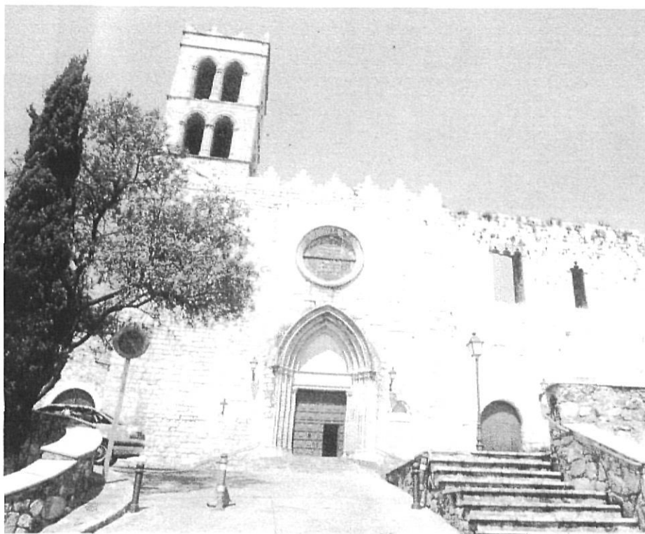
Església i castell de Blanes. La configuració del centre de la vila es deu als vescomtes de Cabrera, que instal·laren la seva residència al palau vescomtal situat al costat de l'església de Santa Maria.

A la fi del segle XII, el vescomte Ponç III va tornar a exercir el seu poder en terres gironines. Tot i que només es coneix una composició poètica seva, se'l coneixia amb el nom del Trobador. Potser hi va contribuir també les aventures que va viure: es va casar amb Marquesa, filla del comte d'Urgell Ermengol VII, va ser empresonat a Castella i rescatat després pel rei Alfons I a qui, el 1194, va prometre donar la potestat dels castells de Sant Iscle de Vidreres, d'Hostalric i de Torcafelló, a Maçanet, i no fer sortir mai del castell de Montsoriu cap mal per a les terres reials. Poc abans de la seua mort, el 1195, va perdre les seves terres al vescomtat d'Àger després de caure en desgràcia del rei. Tanmateix, Ponç III degué ser admirat per tota la població del vescomtat de Cabrera i, en especial, pels cavallers que havien obtingut feus en les terres dels Cabrera. Moltes torres i cases fortes que avui encara aguanten dempeus, com les de la Rovira, Vallors i