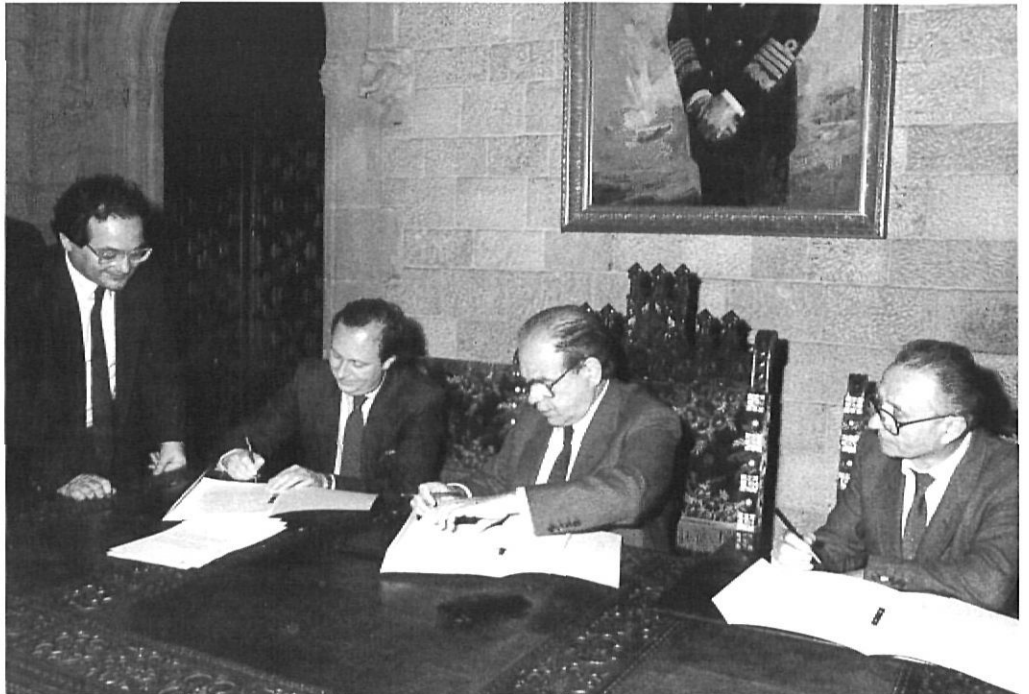
Signatura del conveni de col·laboració entre la Generalitat i la Fundació Casa Ducal de Medinaceli el 1987.

Amb el mateix esperit que fou assumit el projecte d'implantar un centre documental de tot Catalunya, la Fundació estigué oberta a la idea d'una distribució comarcal a través d'una segona còpia de documents, i per això mateix les propostes efectuades des de diferents òrgans territorials van ser acollides amb entusiasme. Així es féu amb l'Arxiu Comarcal de l'Alt Sobirà, a Sort, Falset, Hostalric i Castelló d'Empúries.