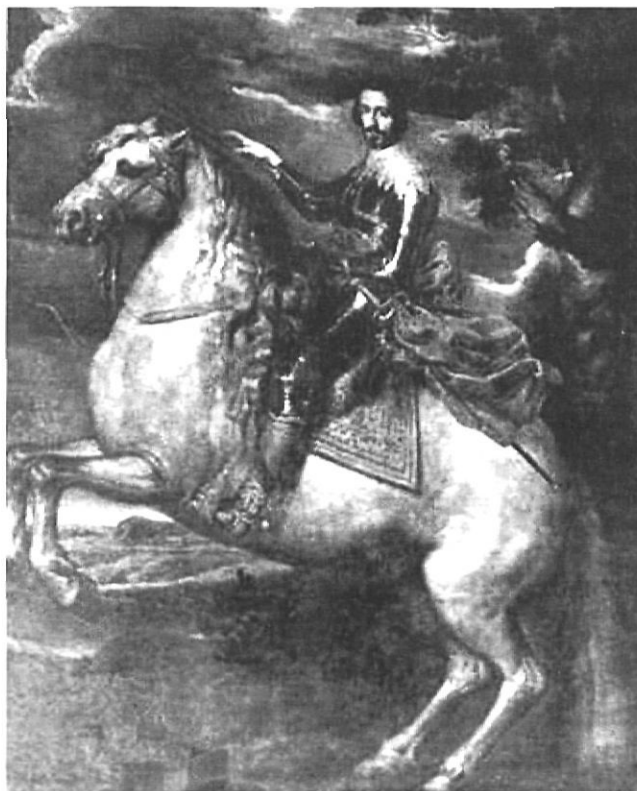
Francesc de Montcada, marquès d'Aitona.

Especialistes en la història de Catalunya han divulgat àmpliament els aspectes més notoris dels Montcada, i és ben conegut el paper que tingueren en diferents moments històrics com a senescals de Catalunya i