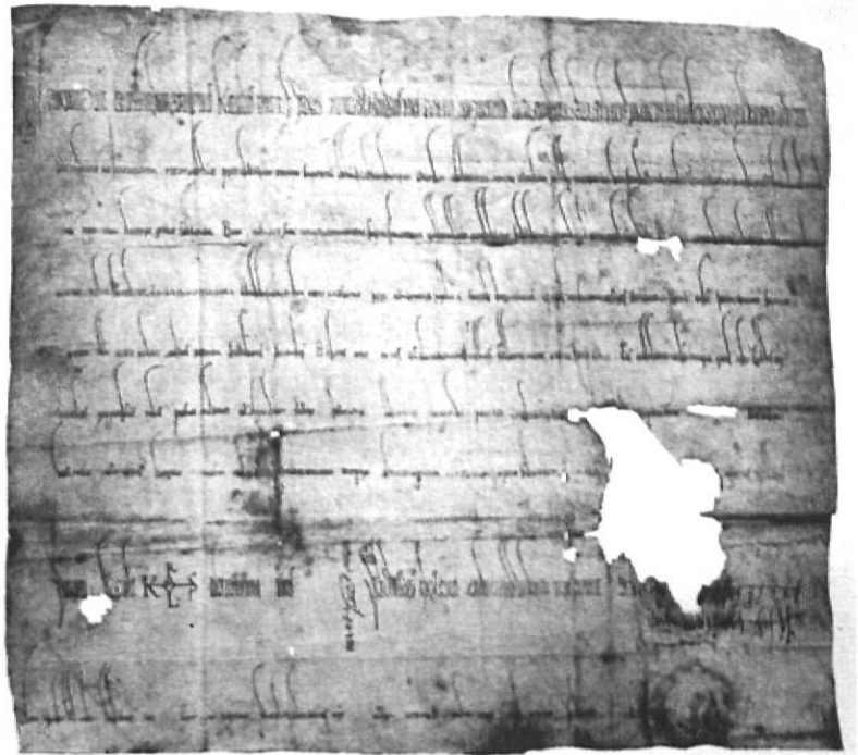
Donació de Carles el Calb al cavaller Auriolo l'any 860.

Els principals entroncaments familiars que portaren la Casa de Medinaceli al cim de la piràmide nobiliària a