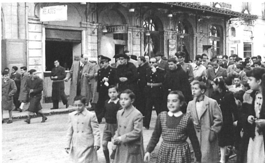
La Bisbal, febrer de 1949. «Fiesta de la Liberación».

En segon terme, Vigo també fou un pensador insigne del temps passat, en especial dels mètodes de la història. Part del seu mèrit en aquest