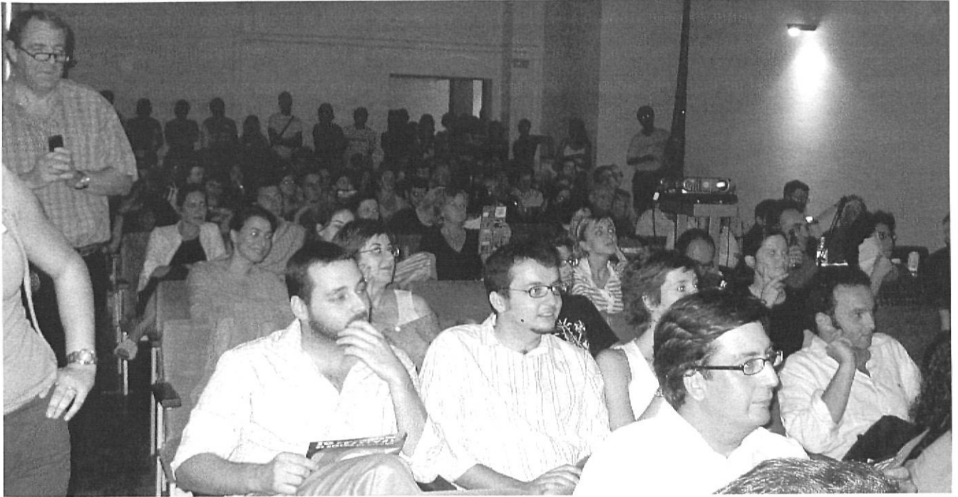
Públic a l'acte de presentació dels autors a "La nit del cinema gironí".