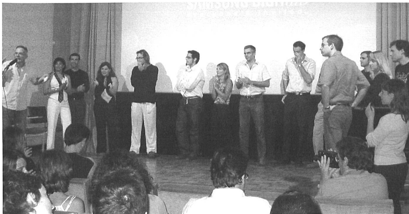
Acte de presentació dels autors de Girona a "La nit del cinema gironí".