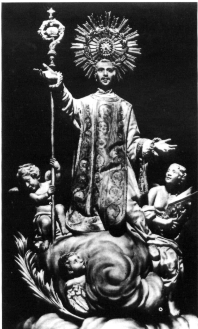
Imatge de Sant Narcís amb bigoti i perilla de general, destruïda el 1936.