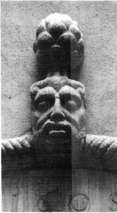
Un arbre de pedra a l'entrada de l'ajuntament de Girona.