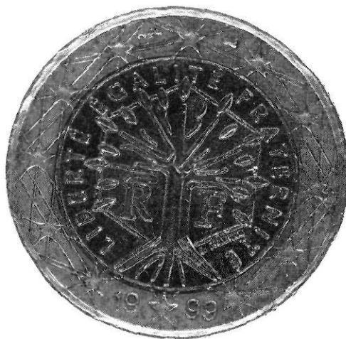
A França, les monedes d'1 i 2 euros duen l'arbre com a símbol de la llibertat.

Amb tot, el significat contemporani de la simbologia es va iniciar durant la Revolució Francesa, un moment màgic i únic pel que fa a la creativitat i als valors socials, en part vinculats al procés de demolició de l'estructura tradicional de la monarquia absoluta i a la transformació de les societats agràries, que va obrir les portes a multitud de manifestacions ideològiques, culturals, socials i polítiques, cadascuna amb la seva pròpia imatge i simbologia. De fet, a la França de final del segle XVIII es va produir una autèntica explosió de l'enginy humà pel que fa la recerca de nous símbols: només cal recordar, per exemple, el culte a l'Ésser Suprem o l'intent fallit d'instaurar un calendari nou. En aquell moment els revolucionaris van adoptar un símbol comú: l'arbre, que a partir de llavors va representar la llibertat guanyada. La França de la Constitució de 1791 es va omplir d'arbres plantats a les places de les poblacions en actes cívics de gran contingut simbòlic, autèntics monuments vius a l'esperit revolucionari, de transformació i de transgressió dels valors tradicionals, d' ancien régime , convertits en elements laics d'una nova religió cívica i ciutadana. A Comprendre la Revolució Francesa (Crítica, 1983), Albert Soboul recull del llibre de Ma-