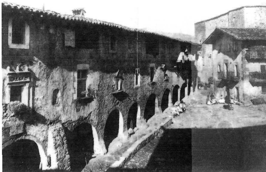
En aquesta plaça Major de Santa Pau se suposa que s'hi havia plantat l'arbre de la llibertat que els homes d'Estartús van tallar i cremar.

En aquest ambient i context de tensió i agitació socials es va esdevenir un procés molt accelerat de transformació de la societat espanyola, catalana i garrotxina. Lògicament, no era el millor dels ambients ni el més desitjat dels contextos per plantejar reformes ni solucions als molts problemes que arrossegava la nostra societat del s. XIX.