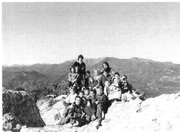
Diada de Dijous Gras. Excursions a Santa Magdalena.

Pràcticament totes les escoles porten una activitat extraordinària, una metodologia renovadora o es valen d'una estructura particular que, indubtablement, les fan més interessants. Valgui com a exemple –no podem esmentar totes les casuístiques– el treball per projectes que des de fa temps s'està portant a l'escola de Boadella. Aquesta escola a més ha assumit el projecte filosofia 3/12, actualment estan treballant de forma específica els mass media i conjuntament amb la resta de les escoles de la ZER (Biure,