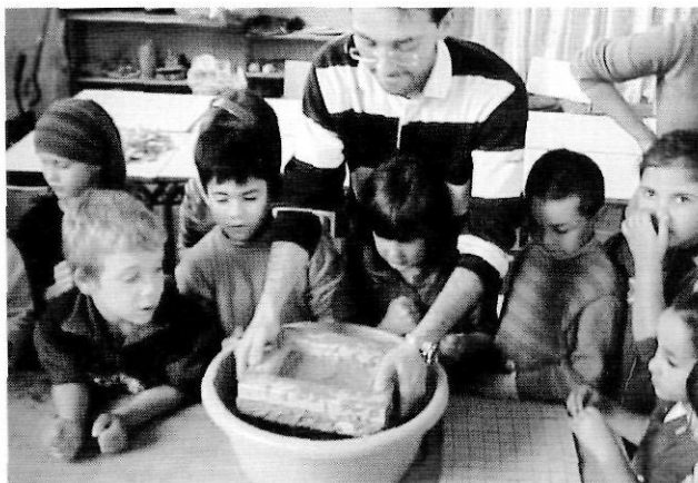
Fent pasta de paper. Escola de Maçanet de Cabrenys.