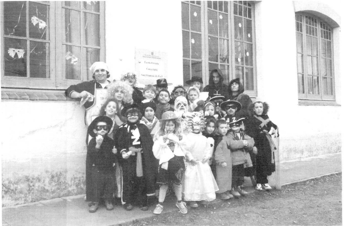
Carnaval a l'escola de Boadella i Les Escalles.

D'altra banda, és notori destacar que durant el curs 1995-96 es va reobrir una escola, la de la Vajol, gràcies a la pressió que feren conjuntament els pares i l'Ajuntament al Departament d'Ensenyament, i gràcies també a la bona predisposició del govern català a atendre les necessitats educatives de pobles rurals que experimentaven un relatiu procés de creixement demogràfic.