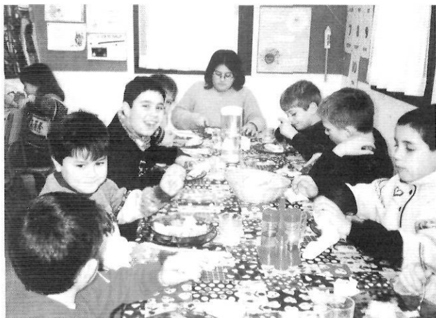
Menjador de l'escola de Boadella i Les Escaules.