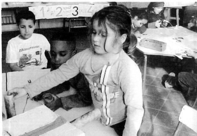
Diversitat a les aules. Escola de Maçanet de Cabrenys.

Ara bé, les ZER, de vegades, també presenten limitacions: dificultat per mantenir la idiosincràsia i la personalitat de cada escola, dificultat perquè cada centre tingui la seva plena autonomia, increment substancial de la burocràcia i del control administratiu, etc. És clar que bona part d'aquestes «problemàtiques» depenen, com deia un mestre, «del valor, del sentit i de la filosofia que l'equip de mestres dóna a la ZER». També caldria afegir-hi una problemàtica que afecta, com a mínim, una de les escoles de l'àrea analitzada: el centre forma part d'una àrea geogràficament molt extensa, fet que dificulta que les escoles tinguin gaire relació. (Vegeu Taula 1).