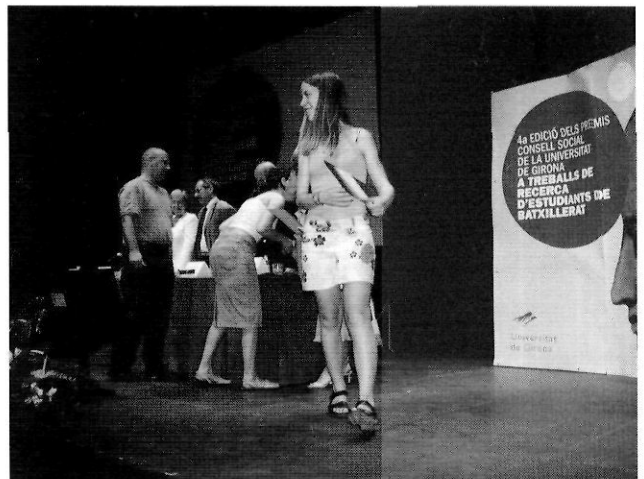
Acte de lliurament dels premis de la UdG, al teatre de Sant Domènec.

Com és lògic, on més proliferen aquest tipus d'iniciatives és dins l'àmbit universitari: universitats públiques i privades com ara la Universitat de Girona, la Politècnica de Catalunya, la de Vic, la Ramon Llull o l'Abat Oliba guardonen els millors treballs amb premis en metàl·lic o, més generalment, amb beques i matrícules gratuïtes, que també són un intent totalment legítim de captació dels millors estudiants com a futurs clients. Dins l'àmbit universitari, també hi trobem premis d'aquest tipus convocats per una determinada facultat (el premi Francesc Noy, de la Facultat d'Humanitats de la Universitat Pompeu Fabra) o, fins i tot, per entitats més o menys vinculades al món universitari, com ara l'Associació d'Història Rural de les Comarques Gironines, que va convocar el premi Mestall per «contribuir a potenciar el plaer de la recerca històrica en el terreny de les ciències socials». En aquest cas, el premi està obert a treballs sobre temes relacionats amb el món rural «en qualsevol dels seus àmbits temàtics, cronològics i geogràfics».