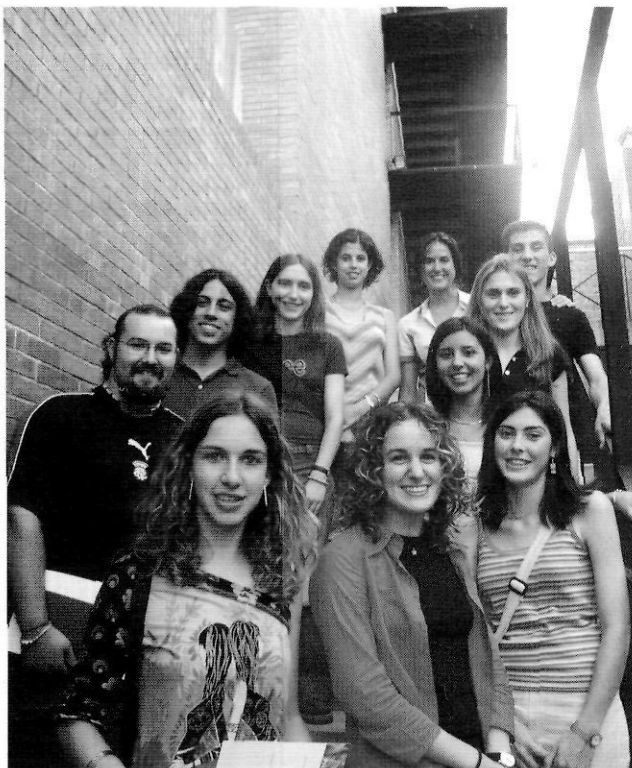
Alguns dels estudiants premiats a l'edició del 2002 dels premis de la UdG.

un pes decisiu en el seu currículum: la qualificació que obtingui per aquest treball representarà un deu per cent de la nota global del batxillerat, tan important quan es tracta d'accedir a la carrera universitària desitjada. «El treball de recerca et demanarà esforç i dedicació, i perquè surti bé és necessari un ingredient fonamental: que t'agradi fer-ho! Per això és força convenient que siguis tu mateix/a qui triï el tema del treball de recerca, més enllà de l'oferta que et faci l'institut». Aquest és un dels «consells inicials» que es proposen a l'alumne des del web de la Xarxa Telemàtica Educativa de Catalunya ( www.xtec.es ), on també se li diu: «Organitza't i deixa't organitzar. El tutor/a que es farà càrrec del teu treball de recerca portarà l'acció de la tutoria en dues direccions: ajuda i seguiment». A l'apartat «Com trobar un bon tema», es proposa a l'estudiant: «Una manera de començar és fer un repàs de les activitats que puguis realitzar fora de l'institut i que hi tinguis experiència, bé perquè formen part del teu temps de lleure, o senzillament formen part del teu interès. Una altra variant és conèixer algú que et pugui facilitar informació d'activitats que et semblen interessants. En definitiva, es tracta d'observar i adonar-se de què tenim al voltant: el món és ple de coses