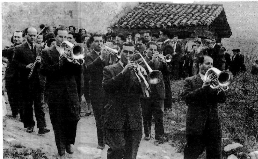
Actuació de la Cobla a la Festa de la vellesa a Sant Esteve de Llémena. Maig de 1953.