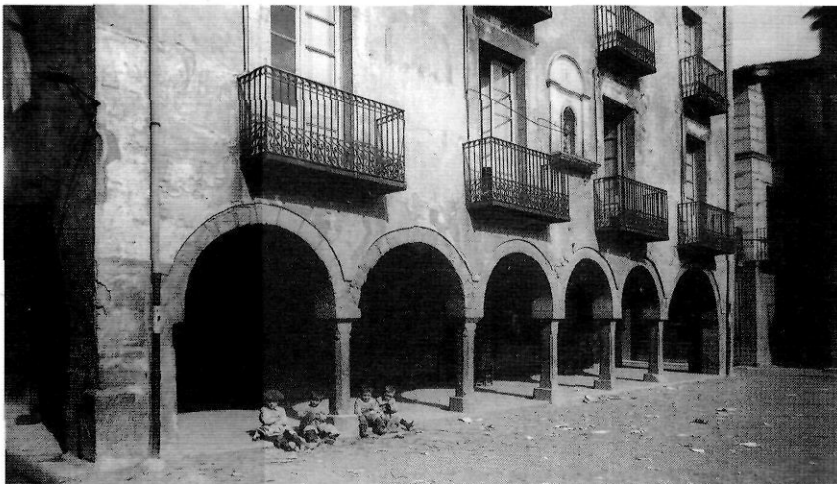
La casa Blanxart, a la plaça Major de Sant Joan de les Abadesses el 1899, aproximadament.