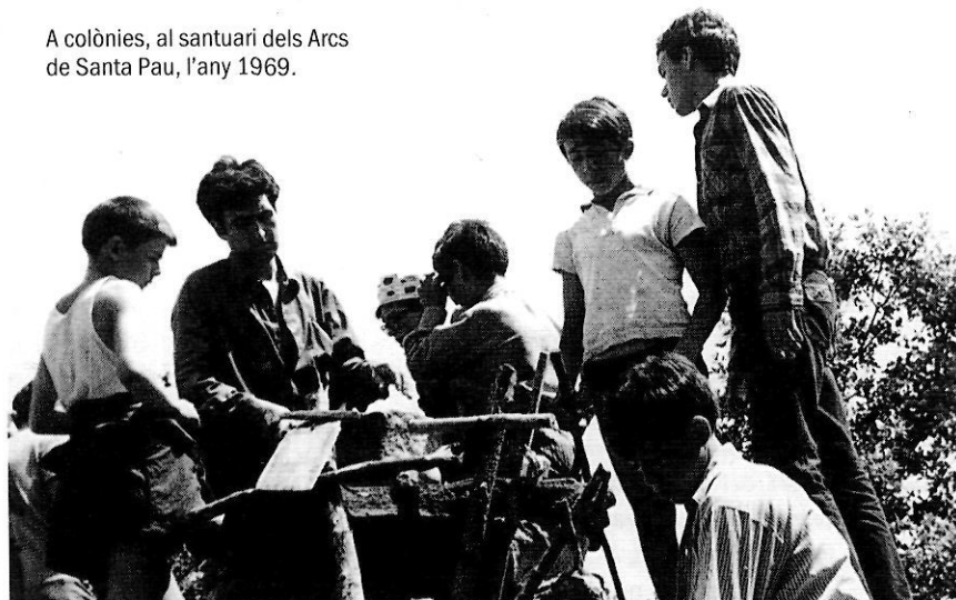
A colònies, al santuari dels Arcs de Santa Pau, l'any 1969.