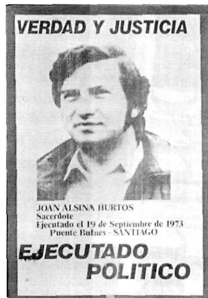
Pancarta exhibida a Xile en una manifestació recent.

El New Age vol homes i dones renascuts ( reborn, rebirth, rebirthing –renéixer) com Mister Bush. El new deal (nous pactes, nous negocis, noves oportunitats; per als yankees , sobretot, i per als seus epígons, el Regne Unit i la Unió Europea), el new deal de Roosevelt s'ha convertit en el new crash bushià (nova ensulsiada), per esclafar tot allò que sigui un obstacle per a l'enriquiment dels qui ja són rics. Homes i dones renascuts, que arriben amb consciència i visió còsmiques, que pronuncien mots nous, discursos místics (pseudoreligiosos) amb els ulls entelats per l'emoció del descobriment de les noves fronteres «espirituals». Governants que comencen les seves sessions de govern amb uns moments de silenci, de meditació, de pregària, de lectura de la Bíblia (llegida en clau fonamentalista, això sí). La lluita fins a la mort de Luther King i Kennedy pels drets civils i la igualtat de races es converteix en tramesa massiva de negres, his-