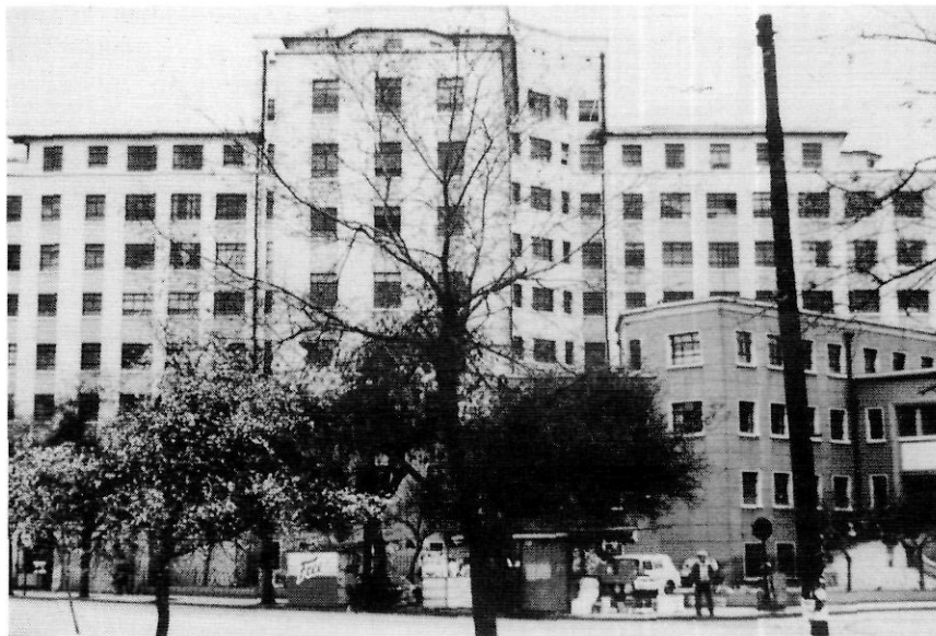
L'hospital de Sant Joan de Déu, on Alsina va ser detingut.