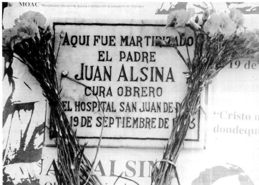
Piaca commemorativa que va ser respectada per la dictadura militar.

Parla d'un Evangeli que fa por als instal·lats, als rics i savis d'aquest món, tant si són eclesiàstics com civils. I anuncia amb força aquest Evangeli radical. En Joan és fill del Concili Vaticà II, i del seu acostament radical a l'Evangeli. El postconcili, el postmodernisme, i el postevangeli radical produeixen nascuts de nou, renascuts (Bush i els seus epígons), produeixen eclesiàstics espantats i, conseqüentment, no evangèlics. Produeixen irritació general, mundial... produeixen New Age . Crec que la pregonera crisi actual de l'Església catòlica és deguda, en bona part, a la mesquinesa espiritual, a poca convicció evangèlica, a la renúncia vergonyant de la proposta de valors de l'Evangeli per part de molts cristians i, especialment, de molts eclesiàstics (algú els anomena «gurus» d'església).