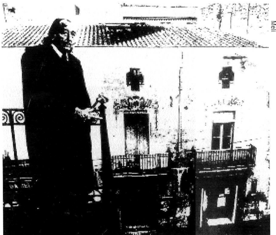
Dalí al balcó de la casa on va viure, a Figueres. Al fons, la farmàcia Deulofeu.

En canvi, sí que s'ha conservat diferent documentació que evidència la relació mútua que existí entre ells durant la primera meitat dels anys vint. Fins i tot existeix una fotografia de grup, feta pels volts del 1925 a la casa de la família Pitxot de Cadaqués, on tots dos apareixen enmig d'una vintena llarga de persones, entre les quals hi havia una significativa representació de la intel·lectualitat local i nacional de l'època.(4) Així, entre d'altres, hi trobem els escriptors Joan Puig i Ferrater,